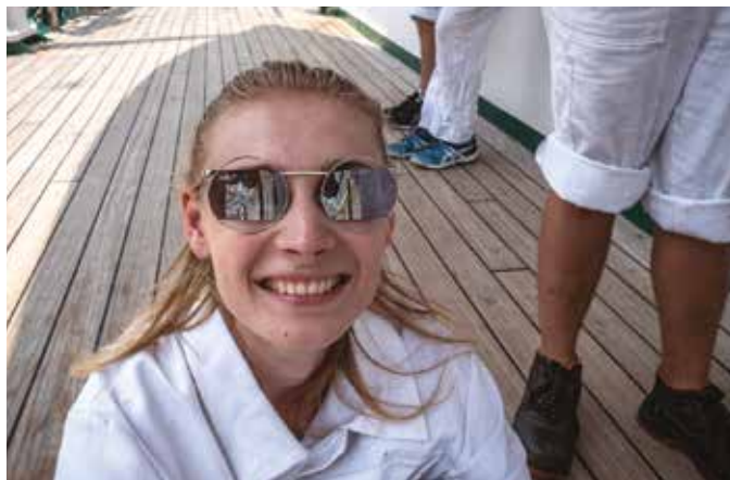
Rejs Niepodległości to niezapomniana przygoda dla uczestników.

Po pełnej wrażeń wizycie w Dżakarcie przyszła pora na ostatni etap naszej podróży. Powoli zaczęłam sobie uświadamiać, że zostały jedynie cztery dni do zakończenia przygody. Nie mogłam uwierzyć, że rozstanę się z ludźmi, z którymi przeżyłam tyle wspaniałych chwil. Z tą myślą płynęło się ciężko, a ostatnie dni mijały o wiele za szybko. Noc przed wplynięciem do portu powitały nas światła luksusowego resortu Marina Bay Sands. W końcu