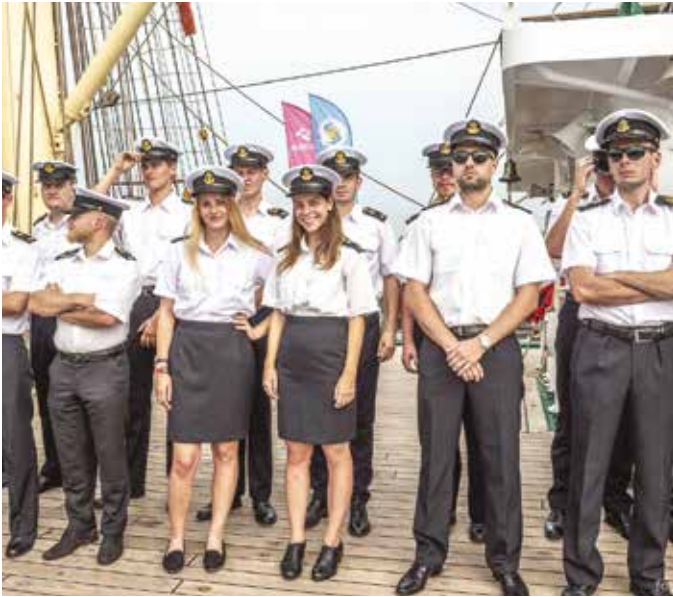
Wpłynięcie do portu.