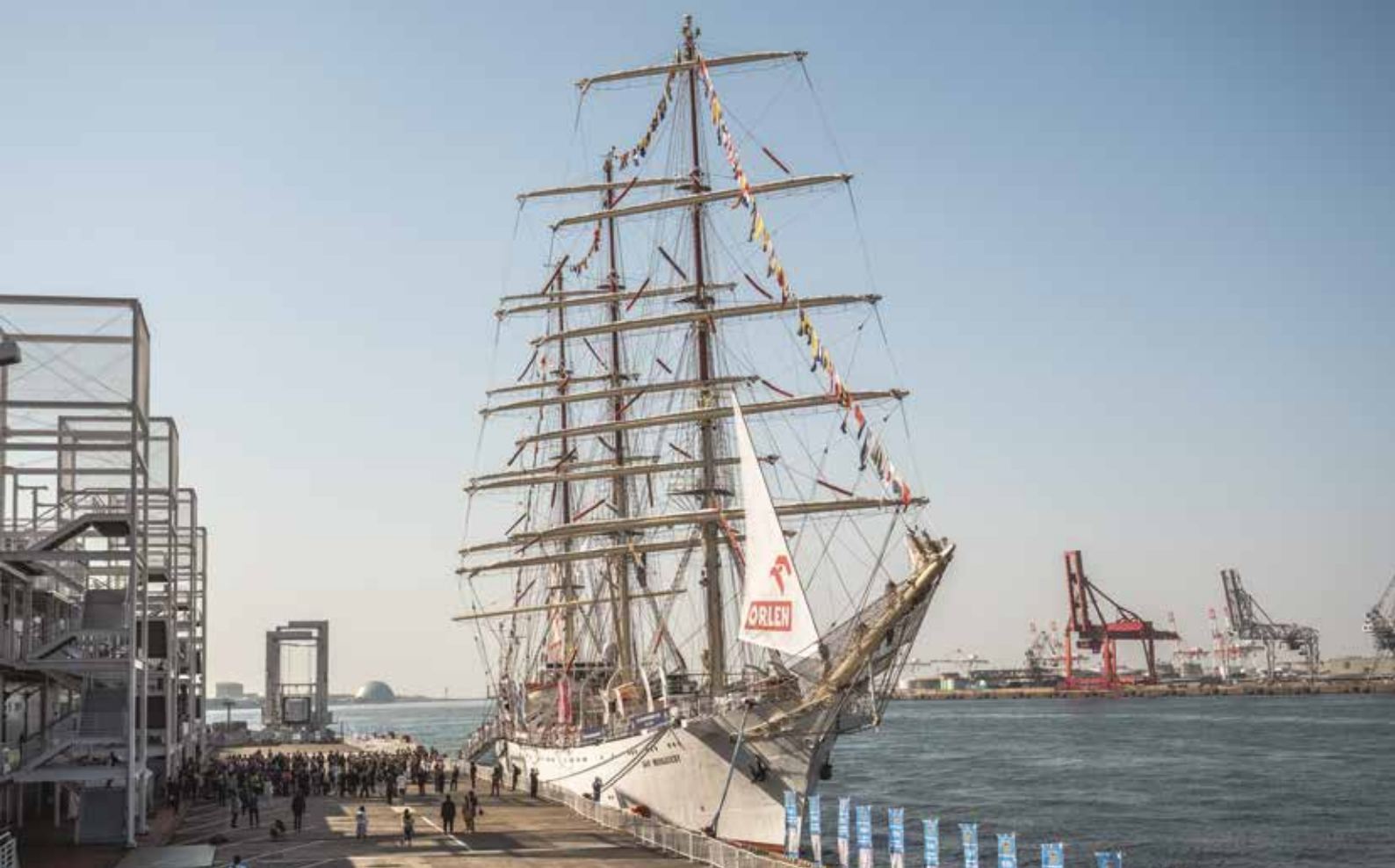
„Dar Młodzieży” podczas historycznych obchodów Narodowego Święta Niepodległości w Osace.

red. Zbigniew Urbani: Gdy zabrzmiały komendy – postawić wszystkie żagle rejoye, ludzie wprost darli liny. 110 sekund i fregata zajaśniała całym pięknem. A wiatr przyszedł i „Dar Młodzieży” już go złapał. Lekko pochylił się na prawą burtę, ... i przyspieszył tak gwałtownie, że zaskoczona holowniki pozostały w tyle...sześć, siedem węzłów. Wspaniały bieg pod małą bandergałą. Na topach masztów i na gaflu trzy polskie bandery i jedna japońska.... Na nabrzeżu olbrzymi tłum. Klaszcze. Słychać gromkie „banzai! banzai! banzai!”... „Dar Młodzieży” zaproszony był wówczas na wielki zlot żaglowców, uświetniający 400 lat zamku cesarskiego w Osace.