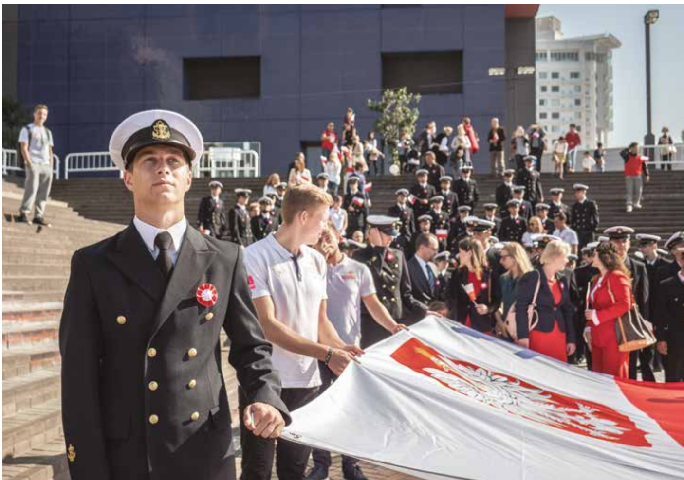
Biało-czerwony przemarsz podczas obchodów Święta Niepodległości w Osace.