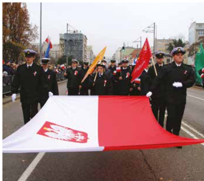
Przemarsz studentów z biało-czerwoną banderą.