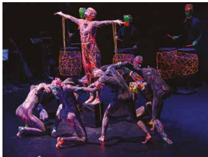
Figury akrobatyczne w wykonaniu grupy Art Color Ballet.

Specjalnie podziękowania wygłosiła także podsekretarz stanu w MG MiŻ Anna Moskwa: