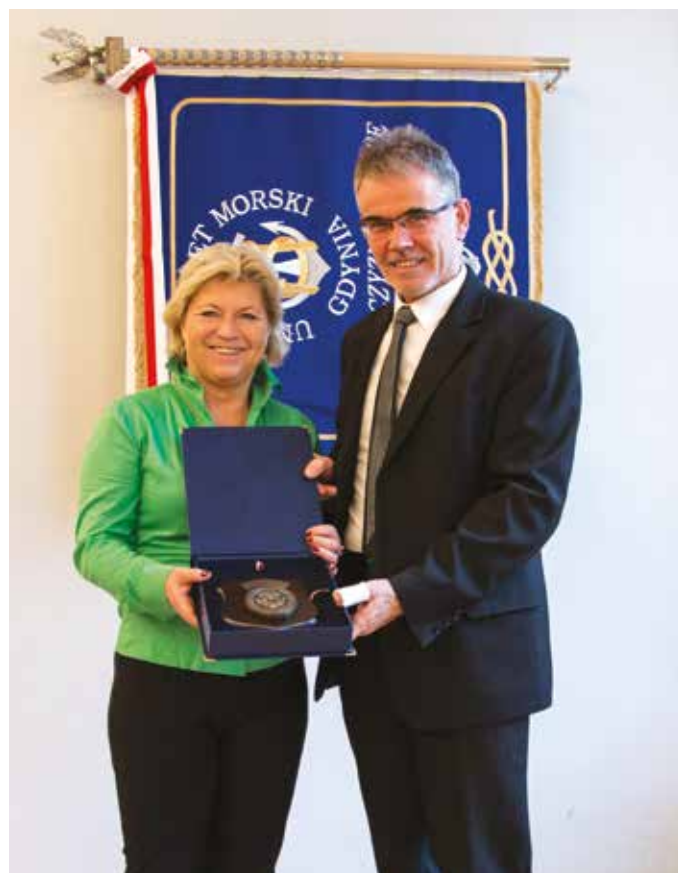
Spotkanie z konsulem generalną Niemiec Cornelią Pieper.