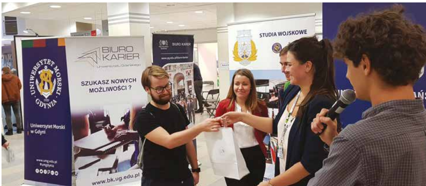
Przedstawiciele Biura Karier UMG przygotowali upominki dla uczestników.