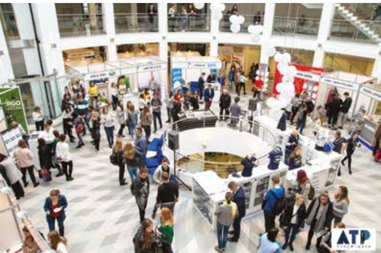
Podczas ATP studenci mieli okazję zapoznać się z ofertą 66 trójmiejskich pracodawców.