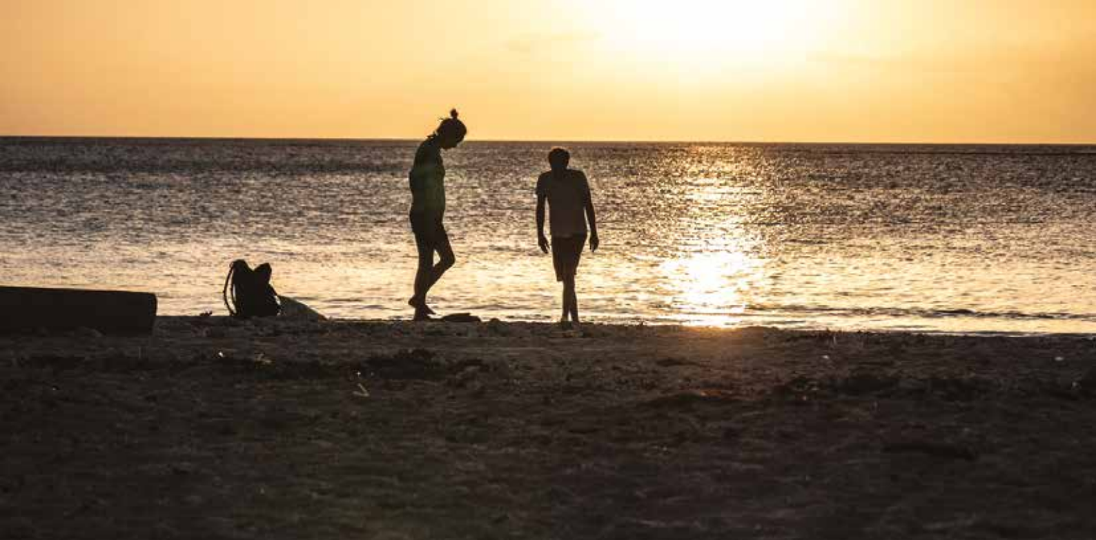
Plaża – jeden z niezapomnianych momentów wizyty na Mauritiusie.

i ogromną wiedzą. Każdy z nas nabył od nich wiele umiejętności, które przydadzą się w przyszłej pracy czy też w życiu codziennym.