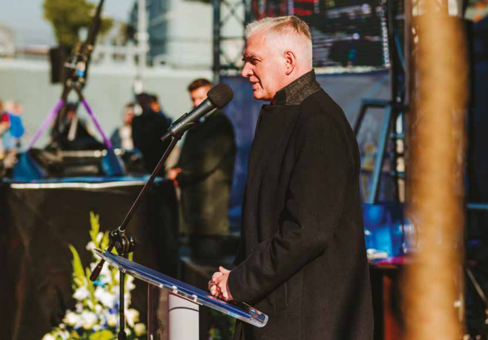
Wystąpienie wicepremiera, ministra nauki i szkolnictwa wyższego Jarosława Gowina.

O godzinie 11:00 na Skwerze Kościuszki rozpoczęła się inauguracja roku akademickiego na Uniwersytecie Morskim w Gdyni. Miejsce Białej Fregaty – „Daru Młodości”, która tradycyjnie uczestniczyła w inauguracji, a obecnie odbywa swój wokółziemski rejs, zajął słynny żaglowiec-muzeum – „Dar Pomorza”, który do 1982 roku pełnił funkcję statku szkoleniowego Uczelni.