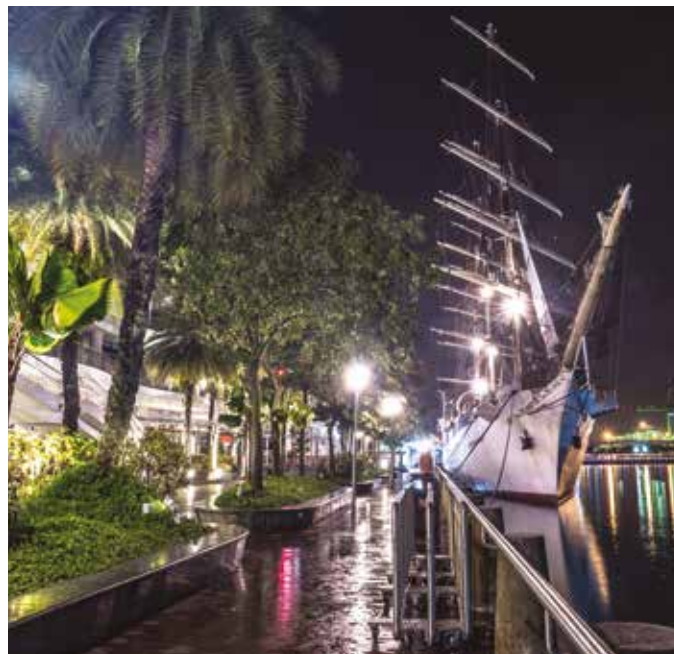
Singapur – miasto, które nocą nabiera bajecznych kolorów.