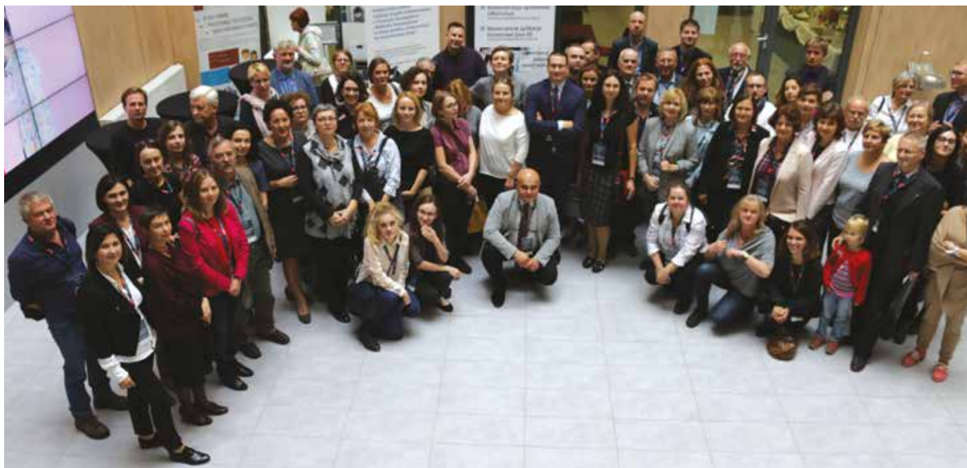
Uczestnicy konferencji na Politechnice Łódzkiej, 18 października 2018.