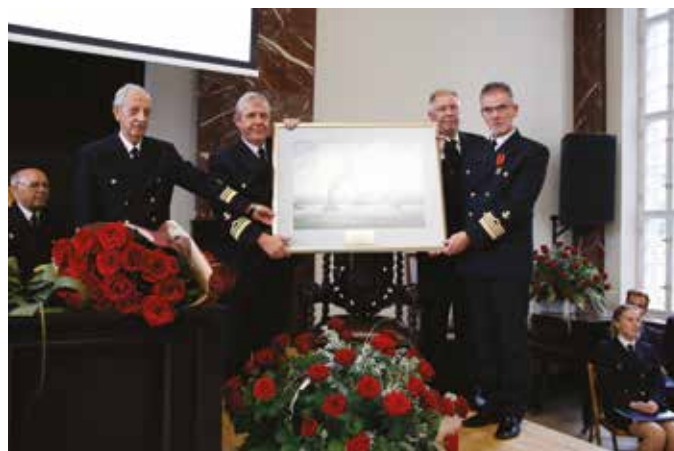
Rektor UMG otrzymał podziękowania i prezenty.