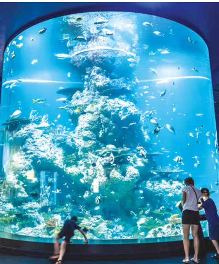
Wizyta w singapurskim S.E.A Aquarium – drugim pod względem wielkości oceanarium na świecie.