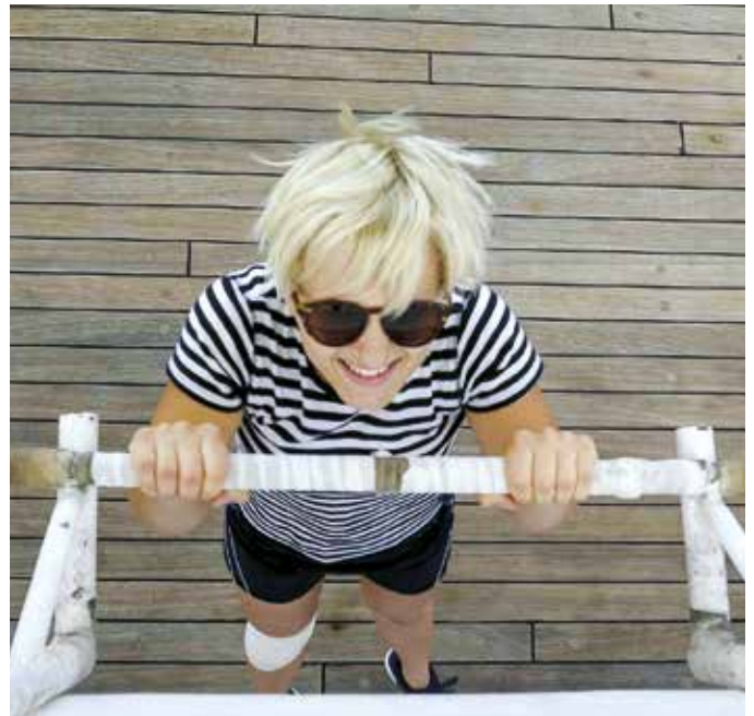
Startujące w zawodach panie udowodniły, że podciąganie na drążku to nie tylko męska dyscyplina.

Zwycięzcy otrzymali dyplomy i gratulacje, życzone im także powodzenia w bicju dalszych rekordów.