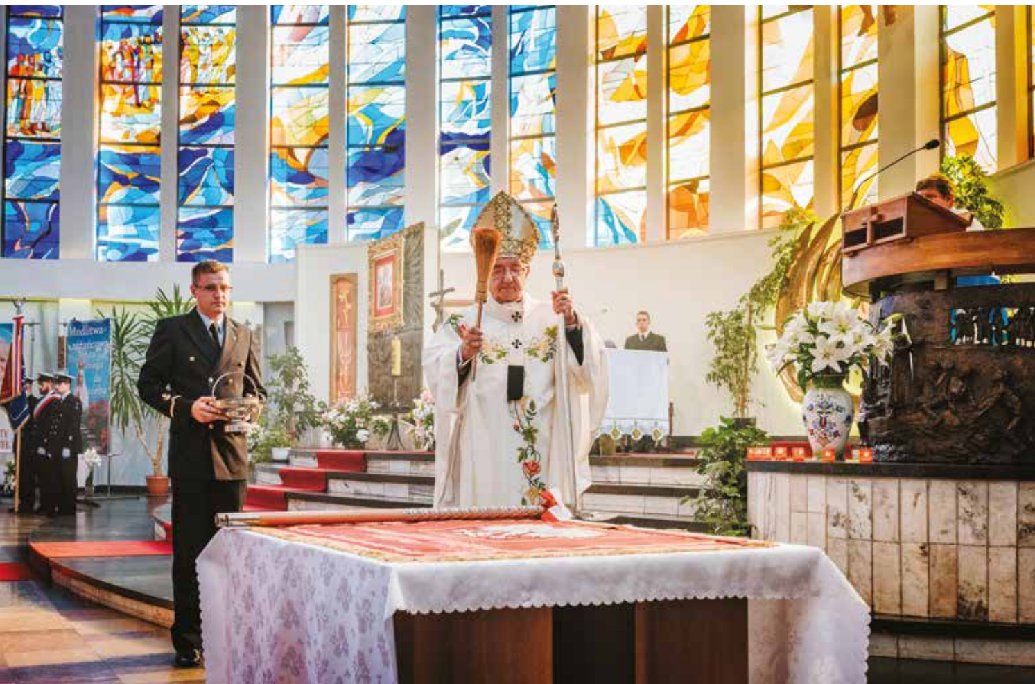
Uroczyste poświęcenie sztandaru Uczelni.

W piękny sobotni poranek, nieopodal legendarnego „Daru Pomorza”, kandydaci na studentów najmłodszego morskiego Uniwersytetu składali ślubowanie już na nowy sztandar Uczelni.