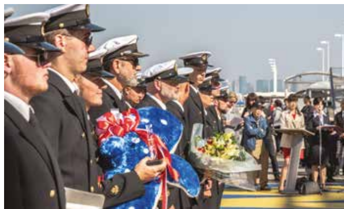
Japońscy gospodarze złożyli uczestnikom Rejsu życzenia z okazji 100-lecia odzyskania niepodległości.