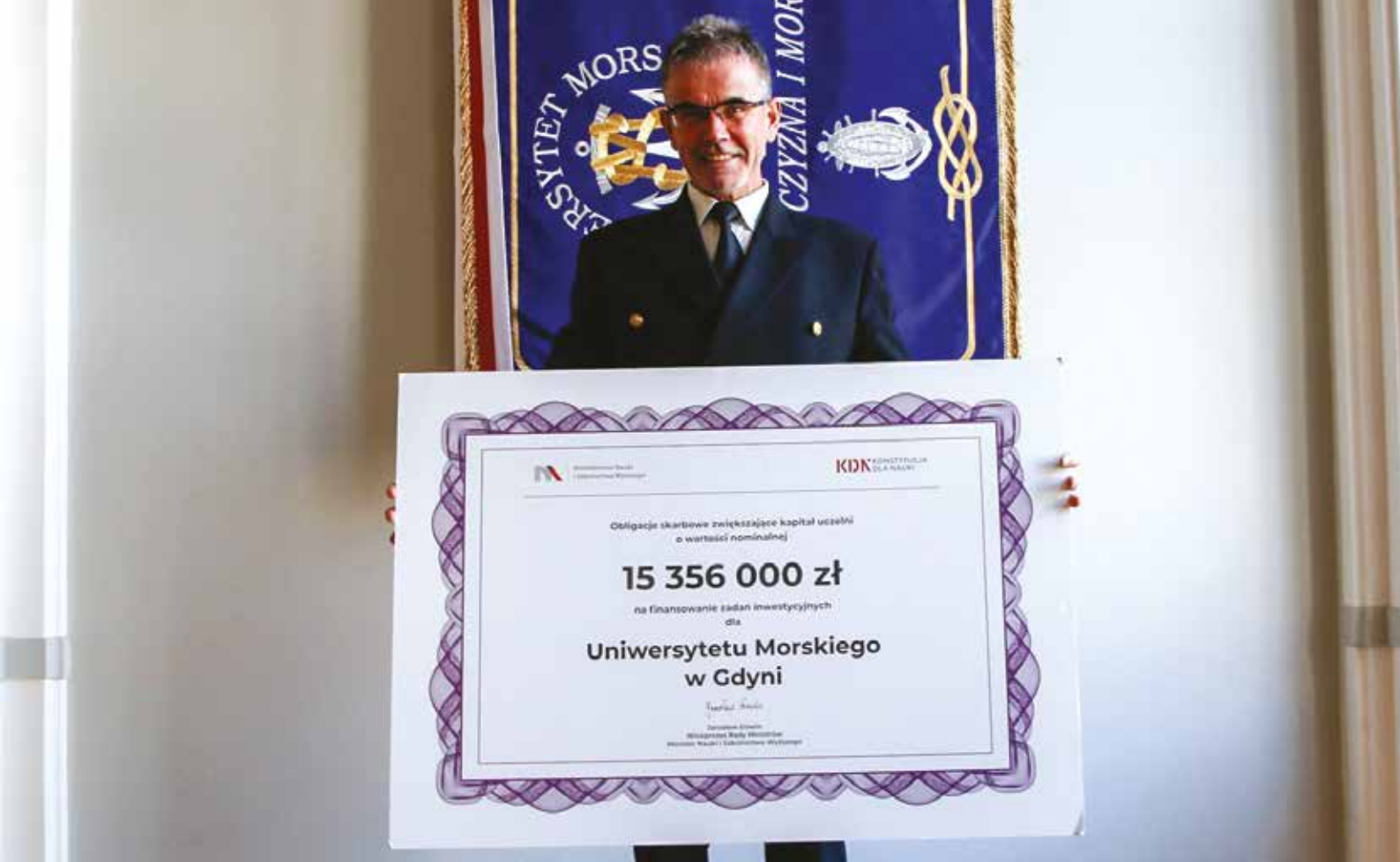
Rektor z symbolicznym czekiem na obligacje dla UMG.