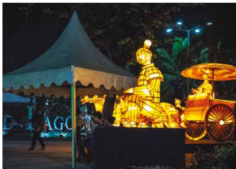
Stolica Indonezji nocą.

Indonezja była niczym z filmów – zatłoczone i zakorkowane ulice, pełno ludzi, a na chodnikach bazyli i targi oferujące mnóstwo rzeczy. Hałas był ogromny! Miałam wrażenie, że tamtejsi uczestnicy ruchu drogowego, by wykonać jakikolwiek manewr, nie używali kierunkowskazów, lecz klaksonów. Cały ten gwar i zgiełk miał jednak swój urok – na długo zapamiętam jazdę na skuterze między autami. Największą atrakcją, jaką mieliśmy okazję zwiedzić, był Taman Mini Indonesia, czyli indonezyjski park miniatur. Podczas podziwiania budowli