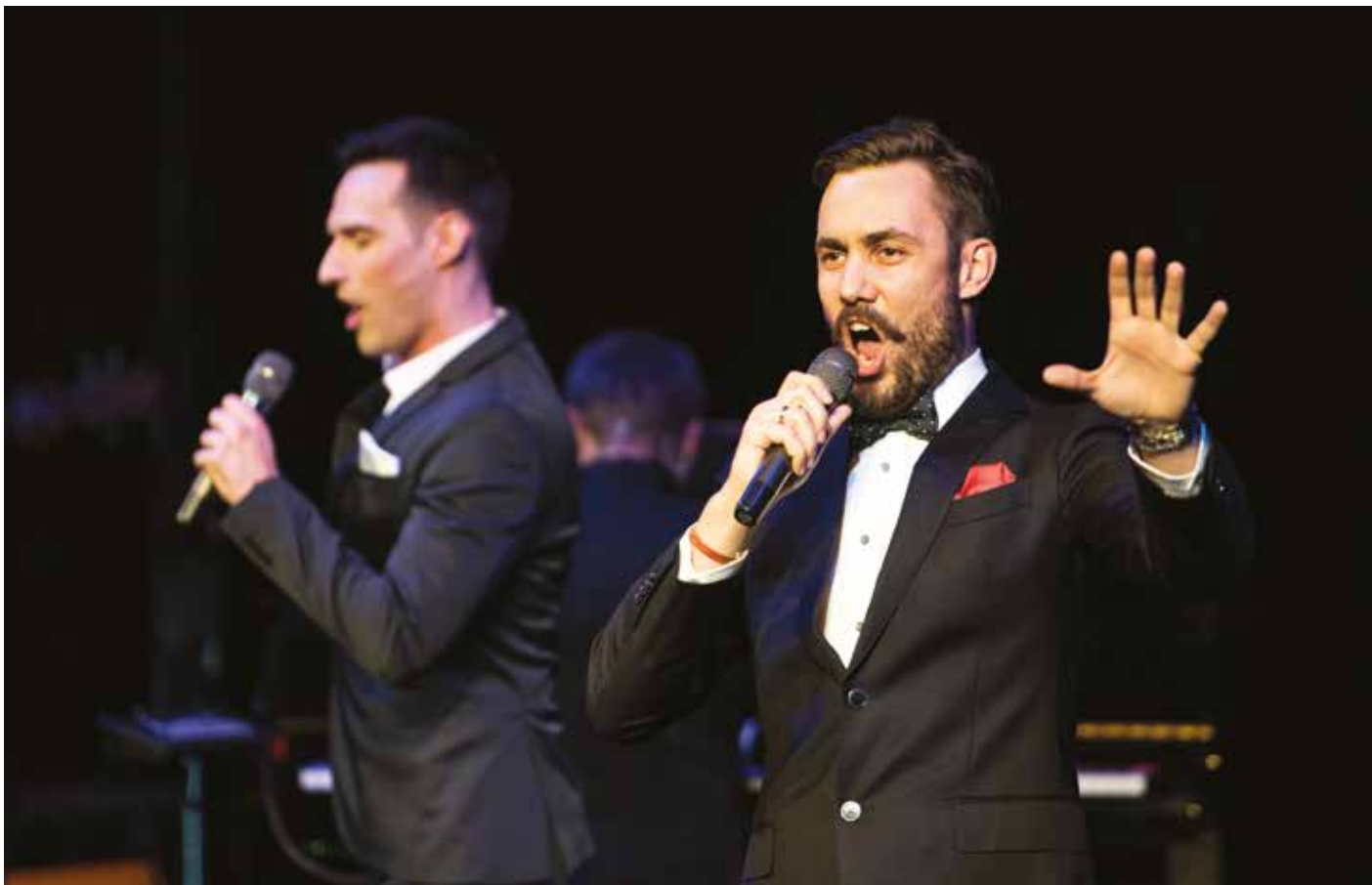
W muzycznej części gali wystąpili tenorzy z zespołu Tre Voci.

polityki, rektorzy i reprezentanci zaprzyjaźnionych uczelni, ludzie morza, przedsiębiorcy, sympatycy i przyjaciele UMG.