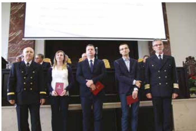
Doktoranci WE odebrali indeksy z rąk rektora UMG oraz kierownika studiów doktoranckich.