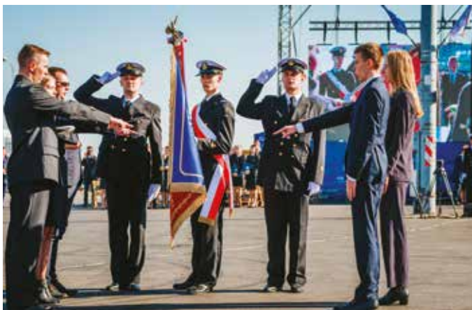
Studenci składali ślubowanie na nowy sztandar Uczelni.