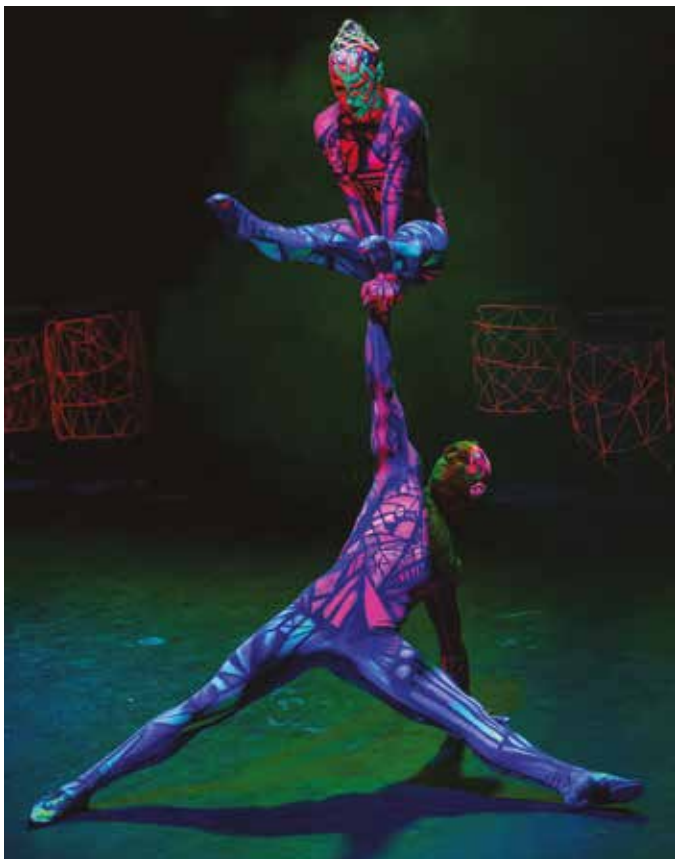
Występ grupy Art Color Ballet to spektakl malarstwa ożywionego, łączący światło, muzykę i taniec.