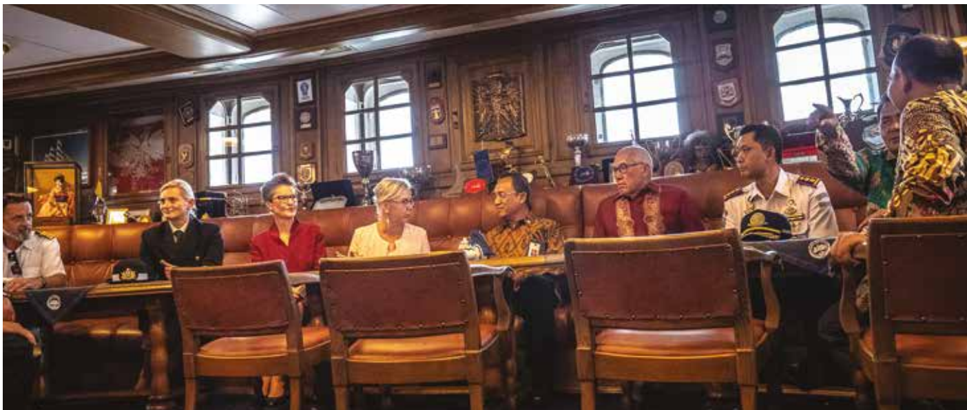
Spotkanie w salonie kapitańskim.