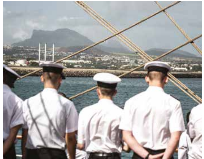
Pierwszy rzut oka na wyspę.