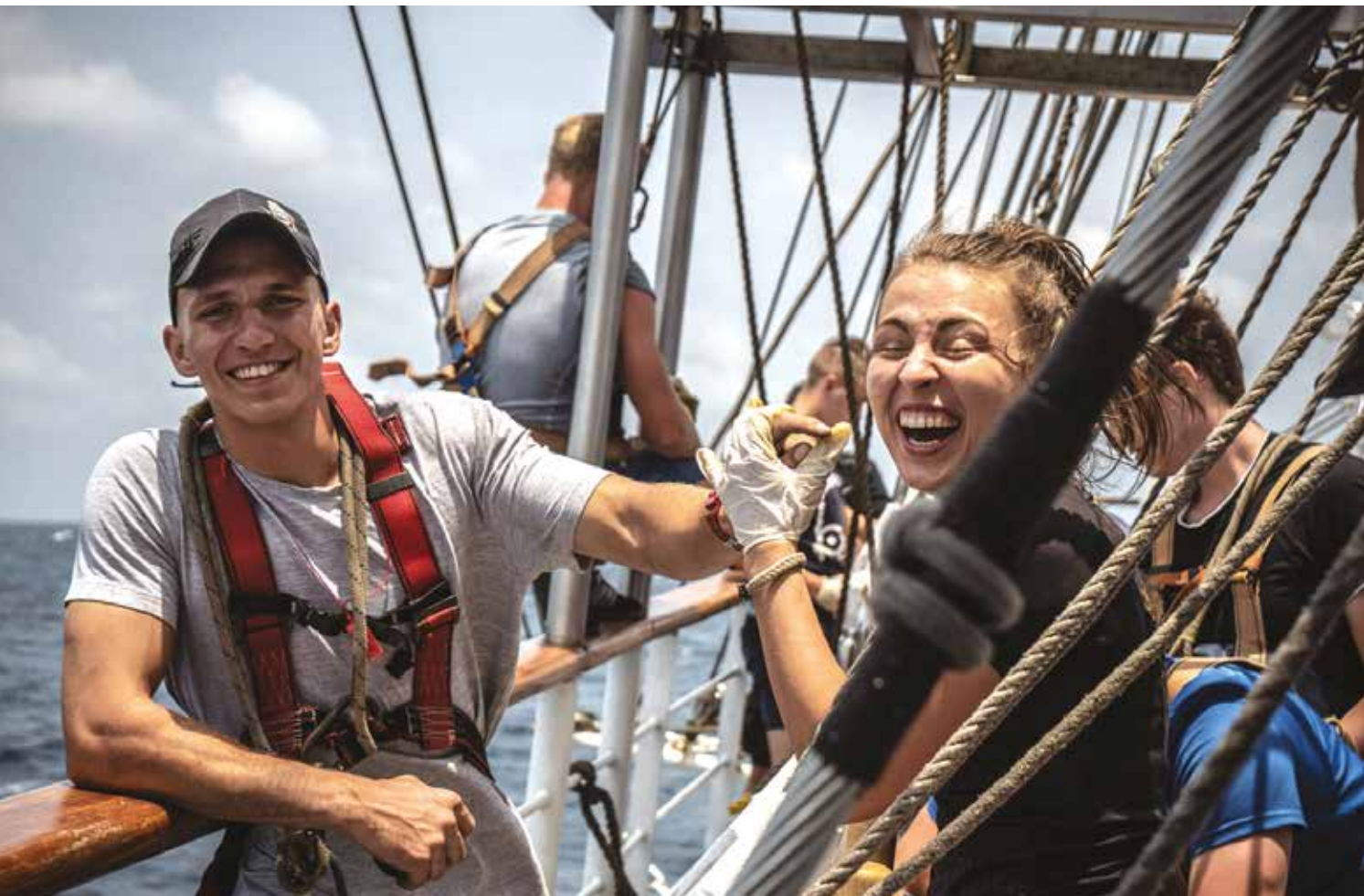
Obowiązkowe mycie pokładu dostarczało sporo frajdy.