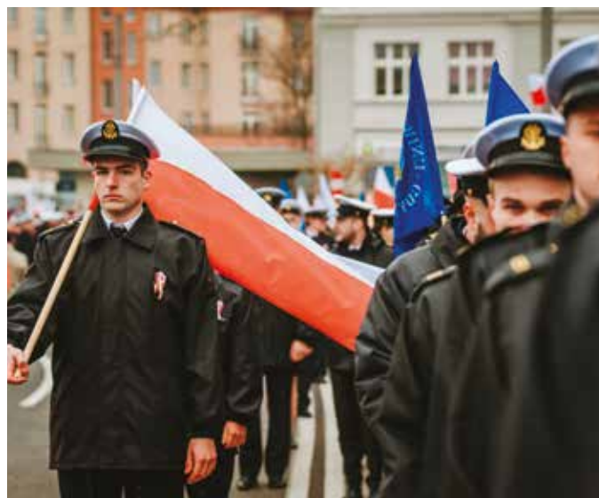
Studenci UMG na Paradzie Niepodległości.