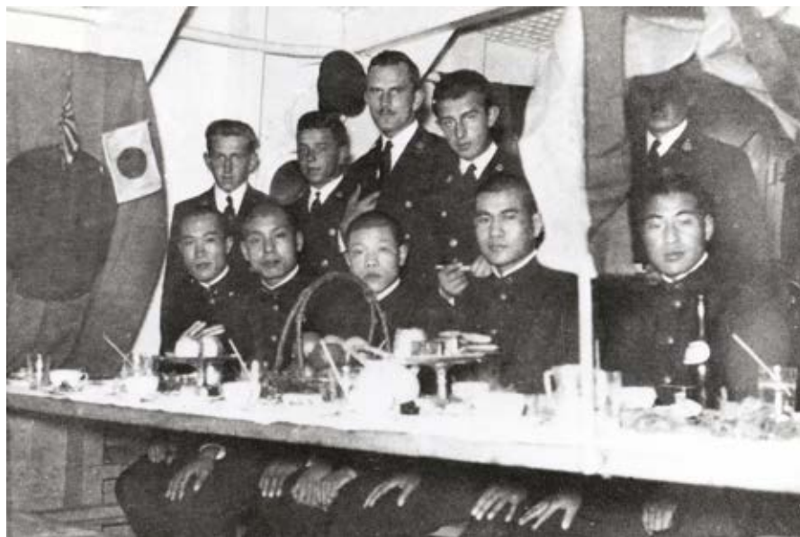
„Dar Pomorza” w Japonii w roku 1935

Zmarł 13 sierpnia 1995 r. w St. Claire Shores, USA. Jego prochy złożono na cmentarzu w Grosse Pointe, Michigan.