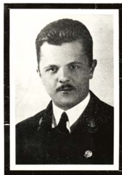
„Praca na Morzu” 1939, nr 2, s. 71