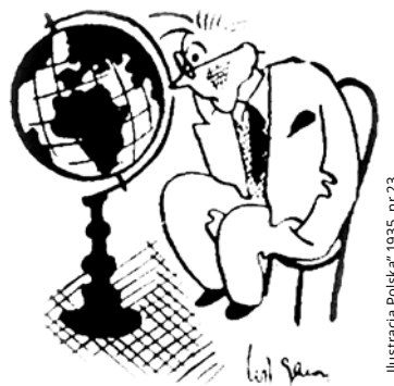
„Ilustracja Polska” 1935, nr 23

Dwukrotnie żonaty, miał troje dzieci. Zmarł 27 grudnia 2004 roku 5 .