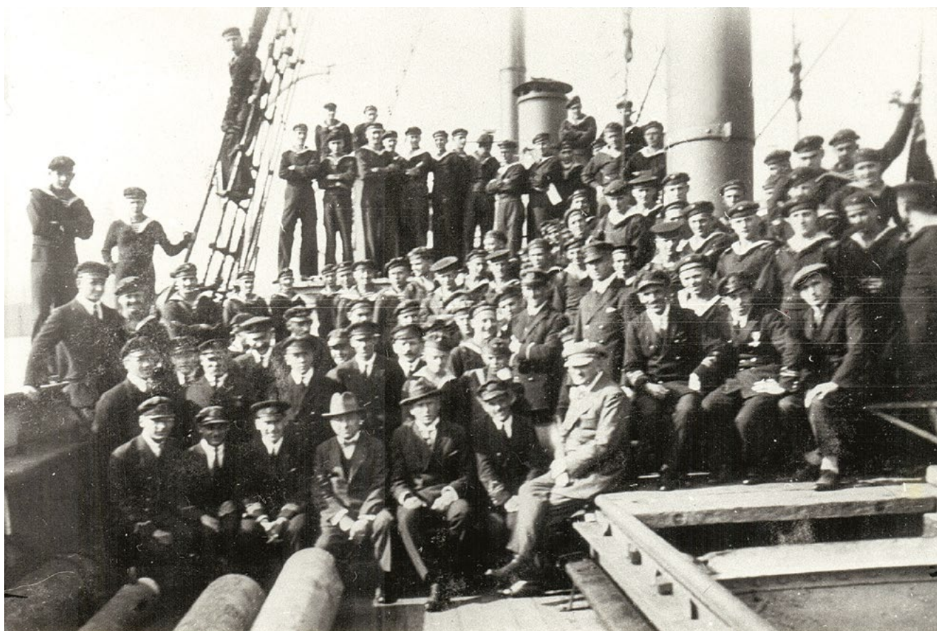
Zdjęcie grupowe na „Lwowie” z roku 1927