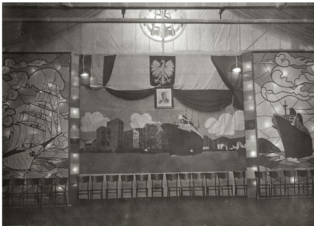
Ustrojona przez uczniów sala w Szkole Morskiej w Tczewie, przygotowana na doroczny bal (zdjęcie z albumu Stanisława Fidosza)