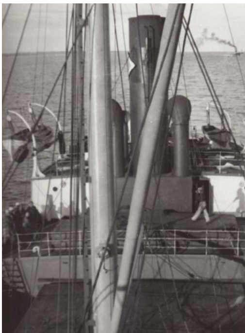
Widok z mostka na rufę „Robura IV”