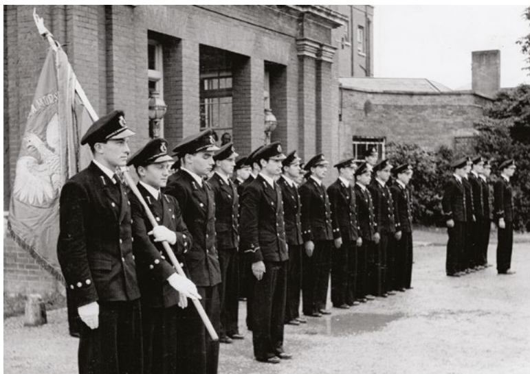
Kadeci III kursu Szkoły Morskiej w Southampton, ze sztandarem PSM w Gdyni

W 1950 r. opublikowano jego pracę „Wiedza okrętowa. Liny, bloki, talie. Osprzęt ładowniczy”, a w 1951 r. – „Wiedza okrętowa. Łodzie okrętowe”.