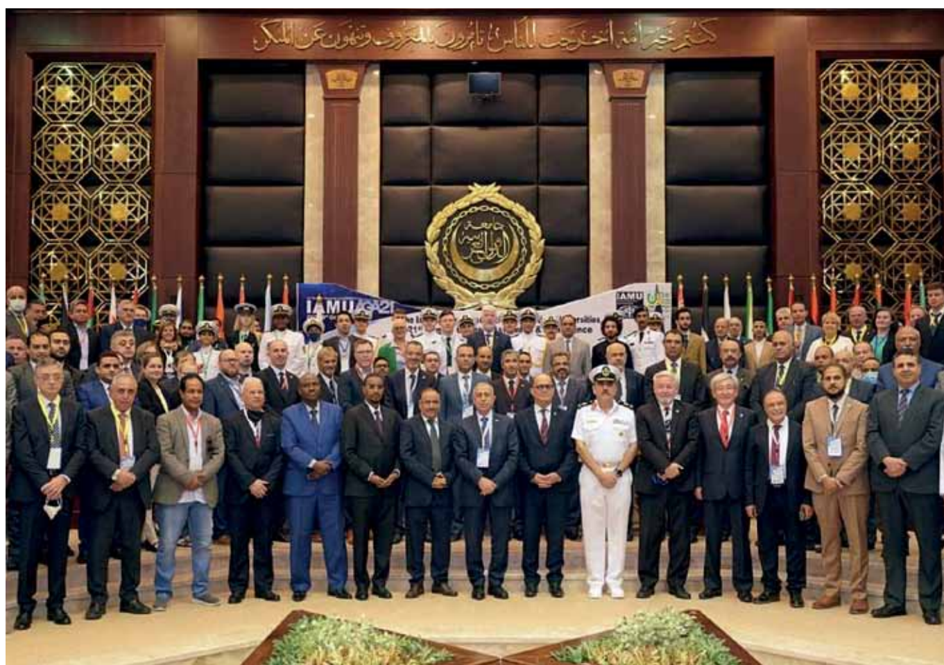
Uczestnicy Zgromadzenia Ogólnego IAMU w auli Arab Academy for Science, Technology and Maritime Transport