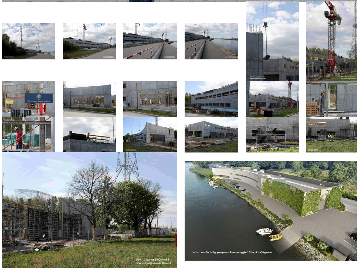
Tekst i zdjęcia: Cezary Spigarski