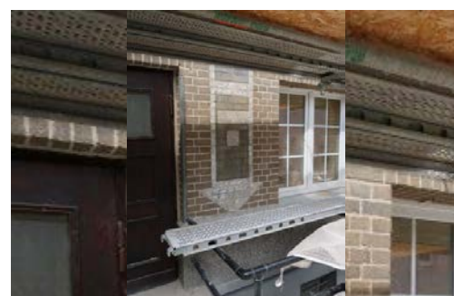
Strzałka namalowana na elewacji wskazująca zejście do schronu z czasów II wojny światowej