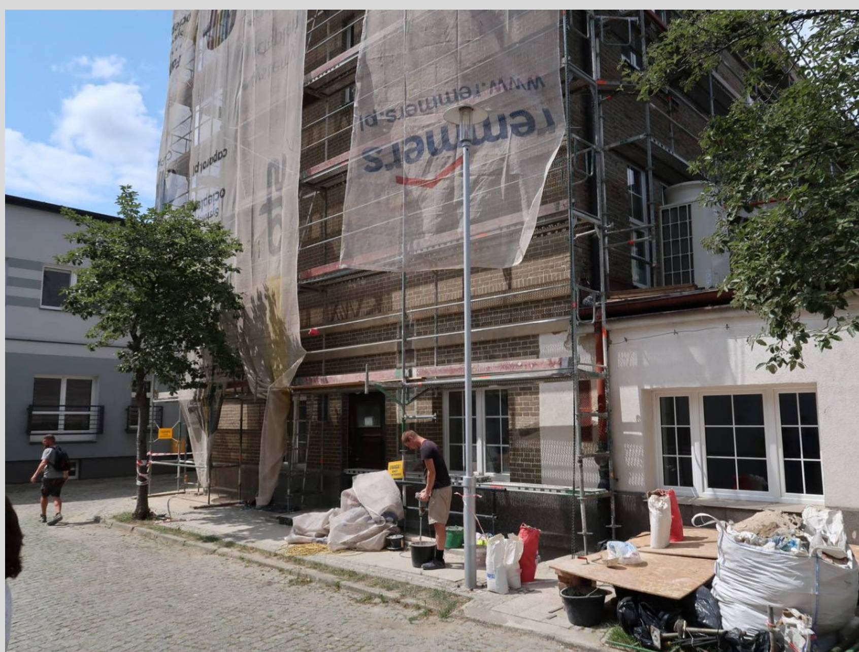
Południowo-wschodnia elewacja budynku A Uniwersytetu Morskiego w trakcie remontu