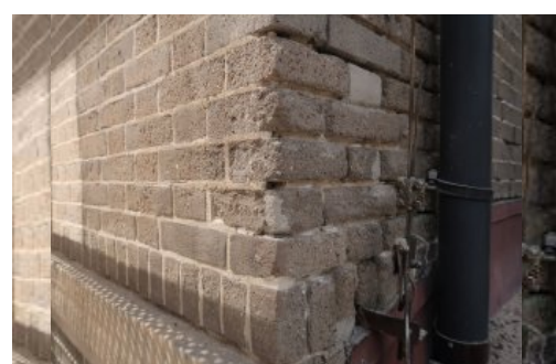
Narożnik elewacji budynku A Uniwersytetu Morskiego