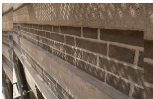
Fragment elewacji budynku licowanej szarą cegłą cementową i z detalem architektonicznym