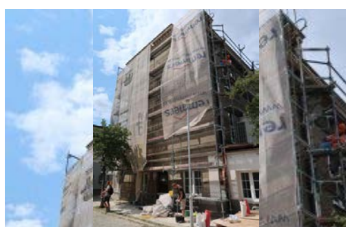
Południowo-wschodnia elewacja budynku A Uniwersytetu Morskiego w trakcie remontu