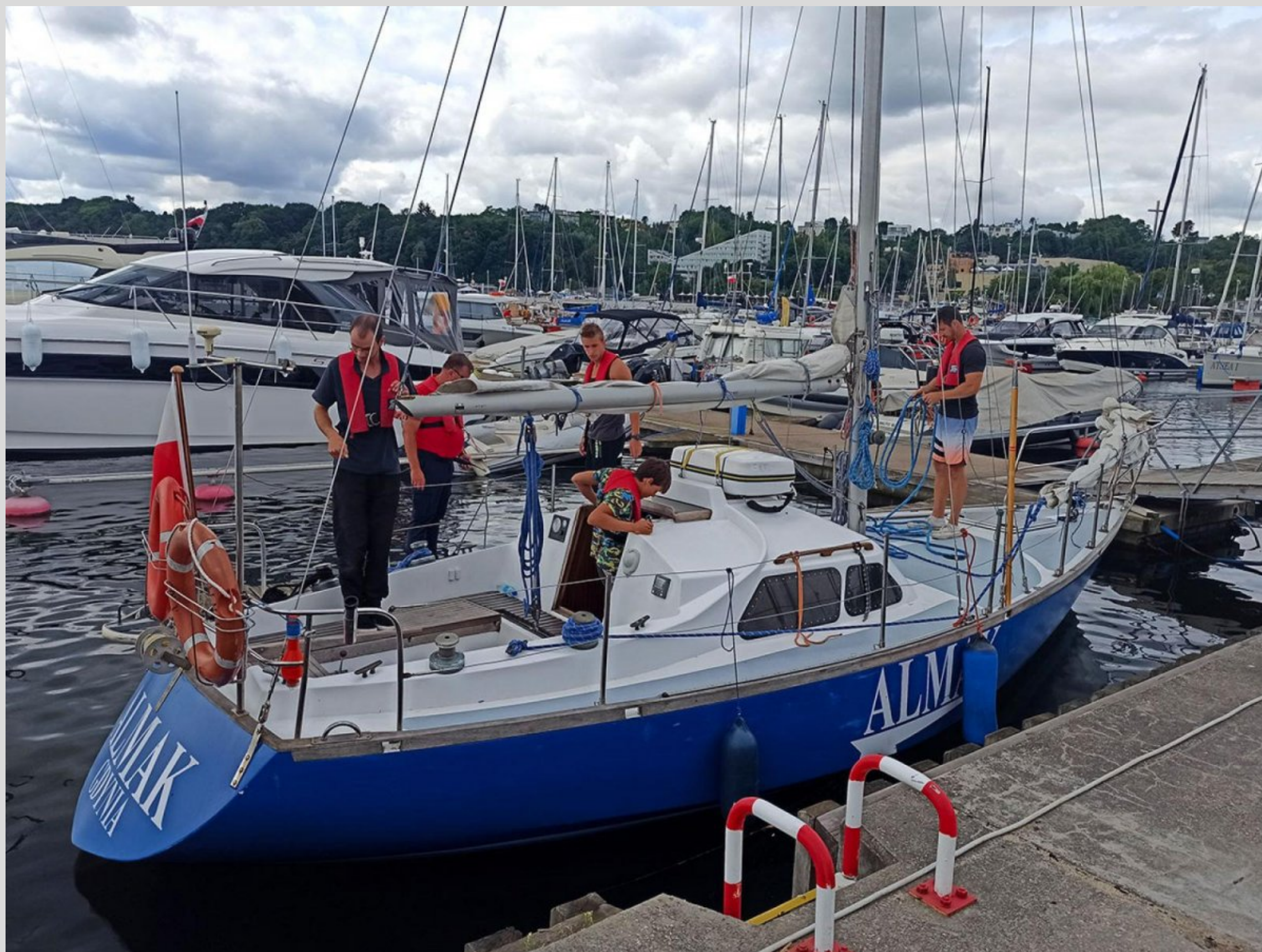
Uczestnicy kursu uczyli się żeglarskich umiejętności m.in. na pokładzie jachtu s/y Almak