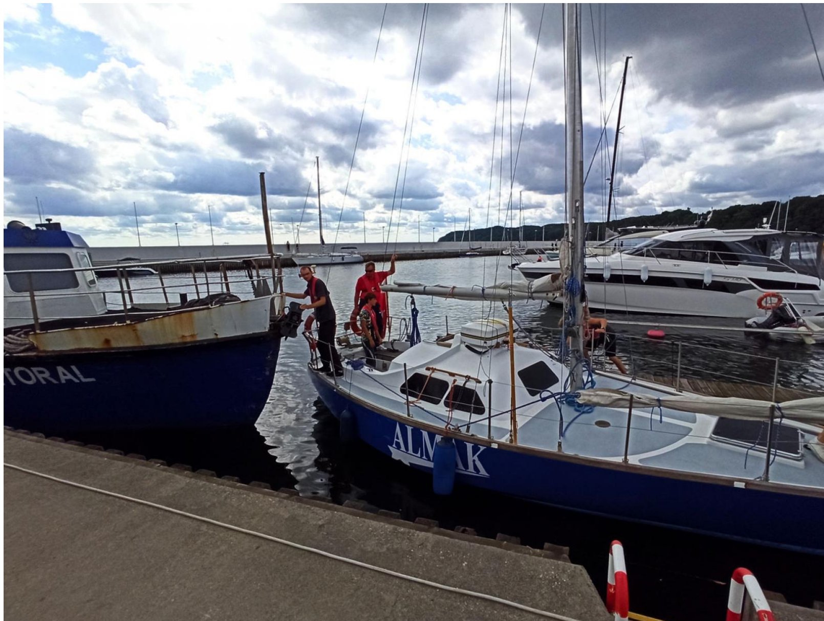
Szkoleniowy jacht s/y Almak w gdyńskiej marinie

Przy egzaminowaniu przyszłych żeglarzy jachtowych skorzystano z należącej do uczelni jednostki s/y Almak , która na co dzień jest wykorzystywana nie tylko do szkoleń żeglarskich, ale także do realizacji krótkich rejsów czy udziału w regatach. Wcześniej kandydaci odbywali też szkolenie na jachtach klasy 2020 dzięki życzliwości Pomorskiego Związku Żeglarskiego, gdyńskiej firmy PRO-AIR oraz Polskiego Stowarzyszenia Klasy 2020.