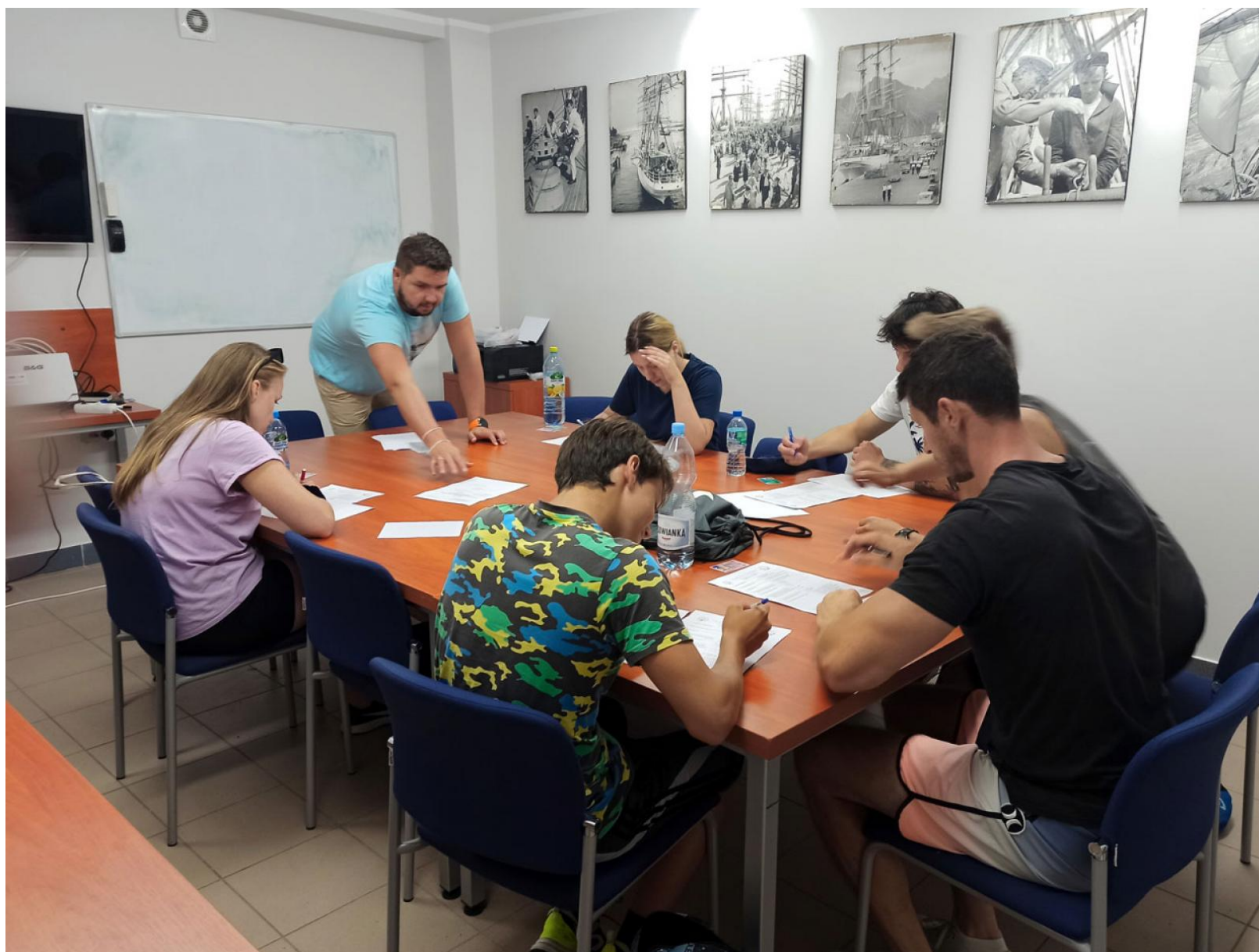
Egzamin na patent żeglarza jachtowego

Jak informuje gdyńska uczelnia, wszystkie podejścia okazały się szczęśliwe dla kandydatów i zakończyły się zdobyciem przez nich nowych uprawnień. Dzięki nim będą mogli sterować jednostkami określonego typu.