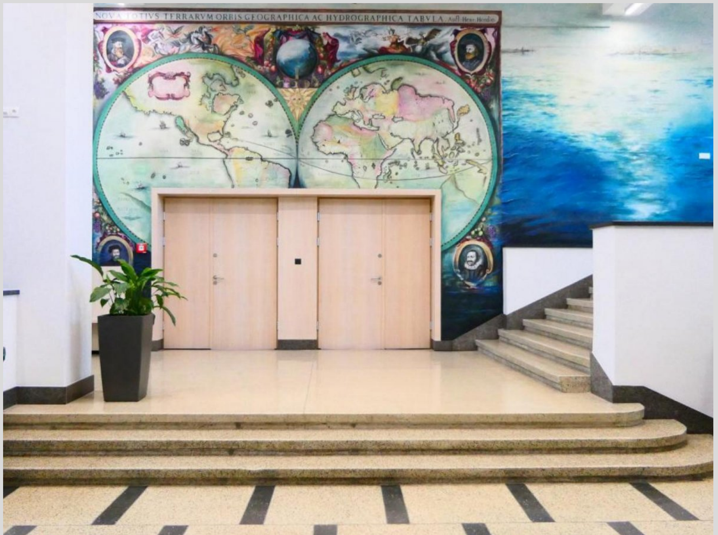
Artystyczna mapa świata zdobi jedną ze ścian w budynku Wydziału Nawigacyjnego Uniwersytetu Morskiego