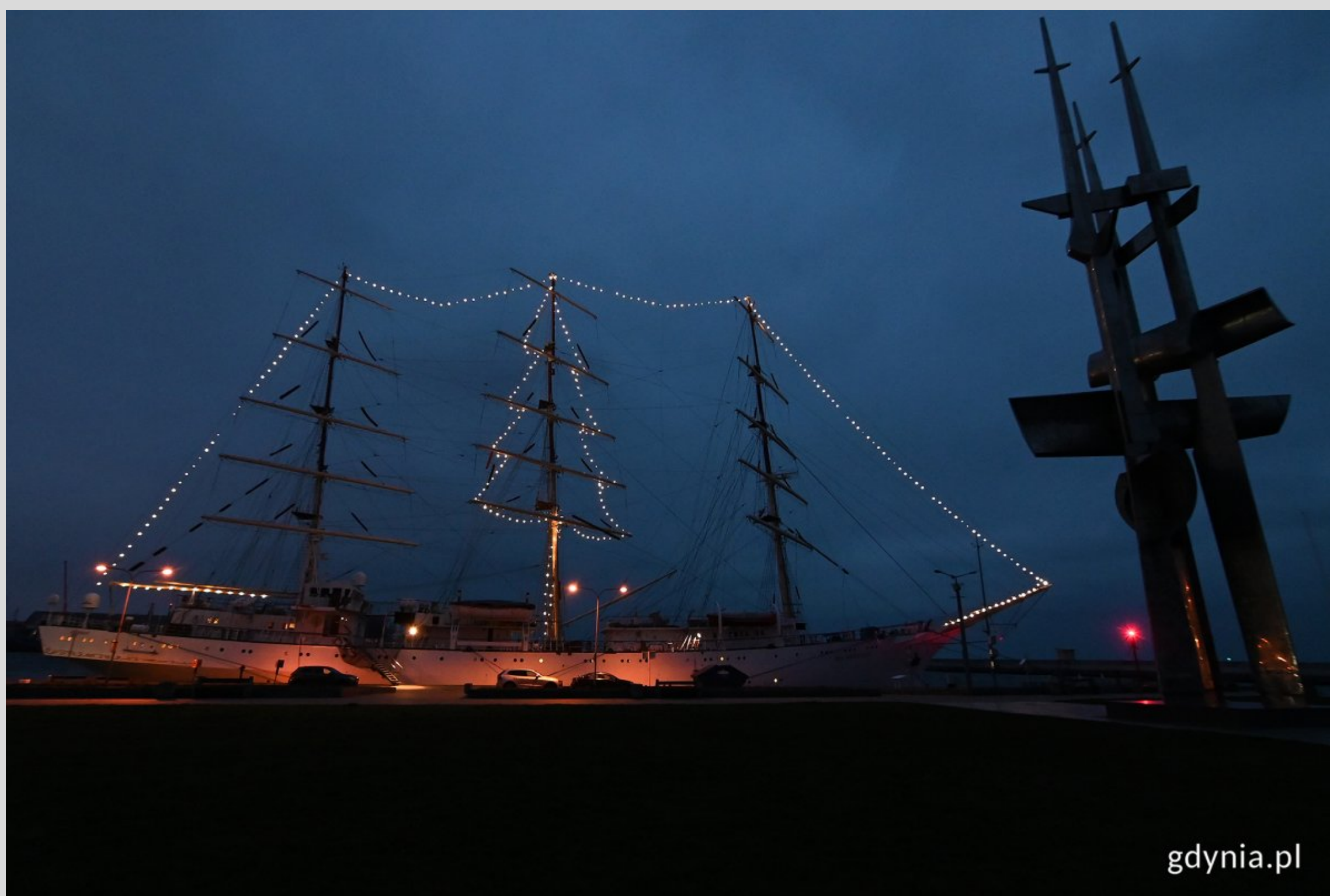
Choinka na masztach "Daru Młodzieży" to już tradycja. Tak wyglądała w ubiegłym roku