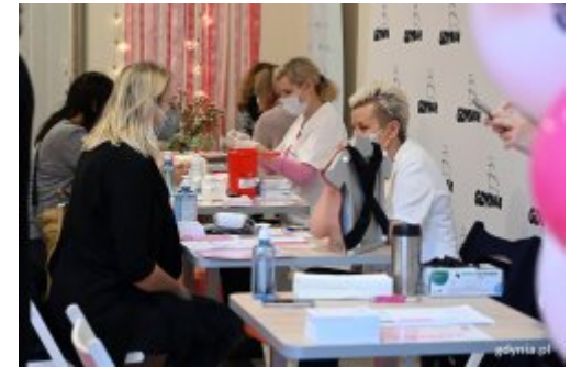
Gdynianki zadbały o swoje zdrowie