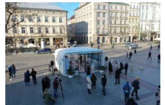
Kraków oddycha Gdynią