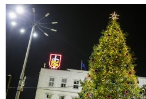
Gdynia pełna świątecznego blasku