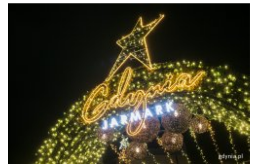
Poczuj magię świąt na gdyńskim jarmarku

Tradycja zapalania światełek na Darze Młodzieży zrodziła się podczas Rejsu Niepodległości w 2018 roku. Żaglowiec w grudniu był wówczas u Wybrzeży Stanów Zjednoczonych w Los Angeles.