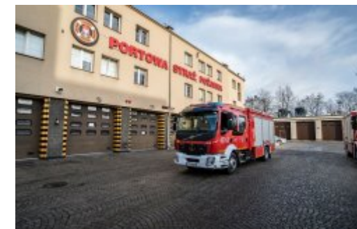
Nowy wóz zabezpieczy bunkrowania ciekłym metanem