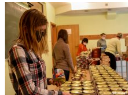
Wigilia dla potrzebujących na wynos