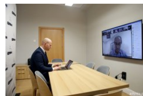
Gdynia z międzynarodową nagrodą za jakość życia