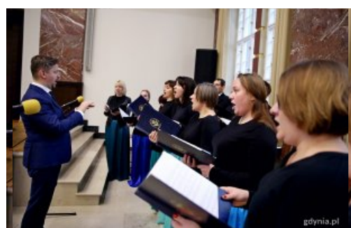
Akademicki Chór Uniwersytetu Morskiego uświetnił uroczystość