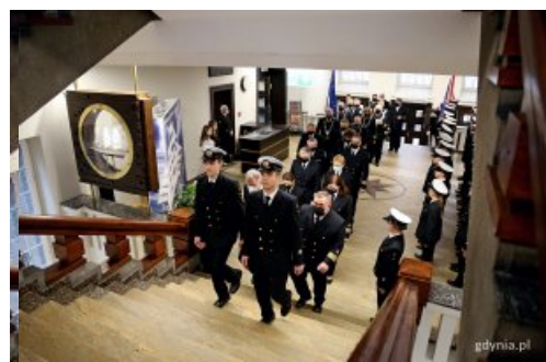
Studenci, władze i wykładowcy Uniwersytetu Morskiego w drodze na uroczyste posiedzenie senatu uczelni