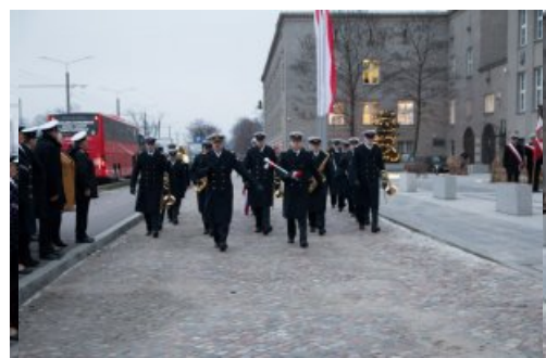
Kompania Reprezentacyjna Uniwersytetu Morskiego podczas uroczystości podniesienia bandery z okazji święta uczelni