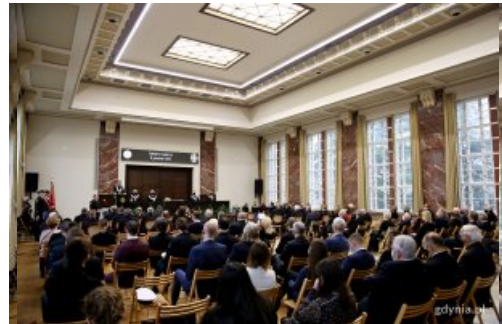
Święto Uniwersytetu Morskiego - uroczyste posiedzenie senatu uczelni