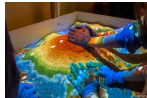
Palcem po piasku. W SP 44 stworzyli interaktywną piaskownicę