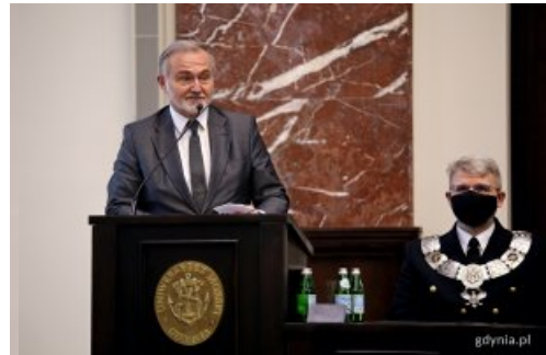
Prezydent Gdyni Wojciech Szczurek przemawiający podczas uroczystego posiedzenia senatu uczelni z okazji święta uniwersytetu