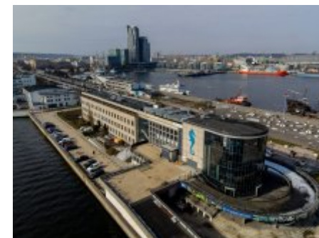
Akwarium podsumowuje rok