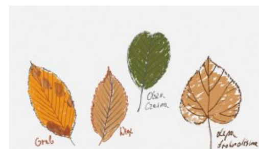
Przyrodnicze lekcje w sieci