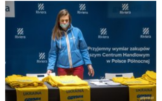
Podziel się dobrem i zakupami w „Rivierze”