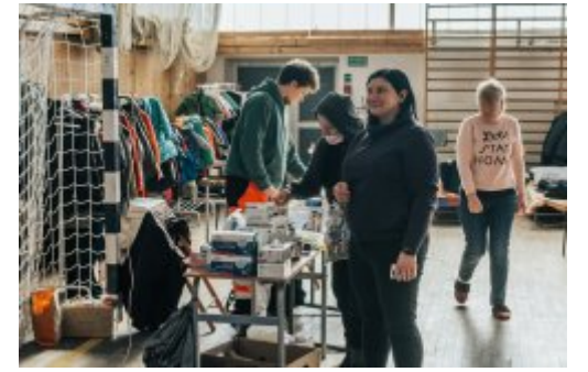
Gdyńskie Centrum Zdrowia z pomocą uchodźcom

Remont w siłowni "Daru Młodzieży".