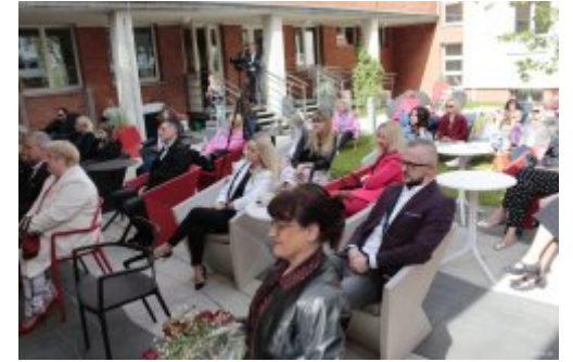
Rozmowy o literaturze. Spotkanie w Konsulacie Kultury