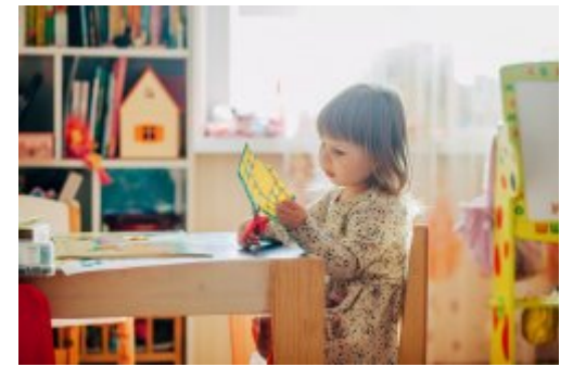
Żłobek i przedszkole dla dzieci z doświadczeniem uchodźczym

Podlewaj deszczówką dzięki miejskiej dotacji