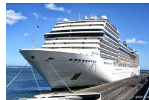
Sezon się rozpoczął. We wtorek nowy rekord