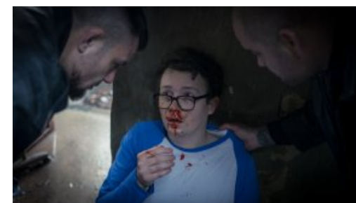
Horror Story. Absolwent GSF pracuje nad czarną komedią