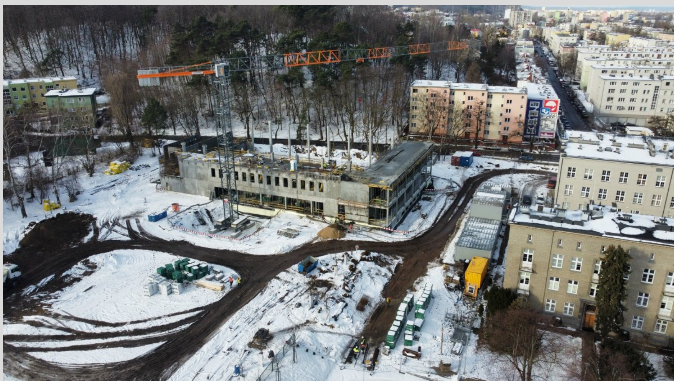
Nowe Centrum Sportu (w centralnej części zdjęcia) osiągnęło już ok. 25% zakresu prac, a ściany hali sportowej sięgają pierwszego piętra, fot. Uniwersytet Morski w Gdyni / mat. prasowe