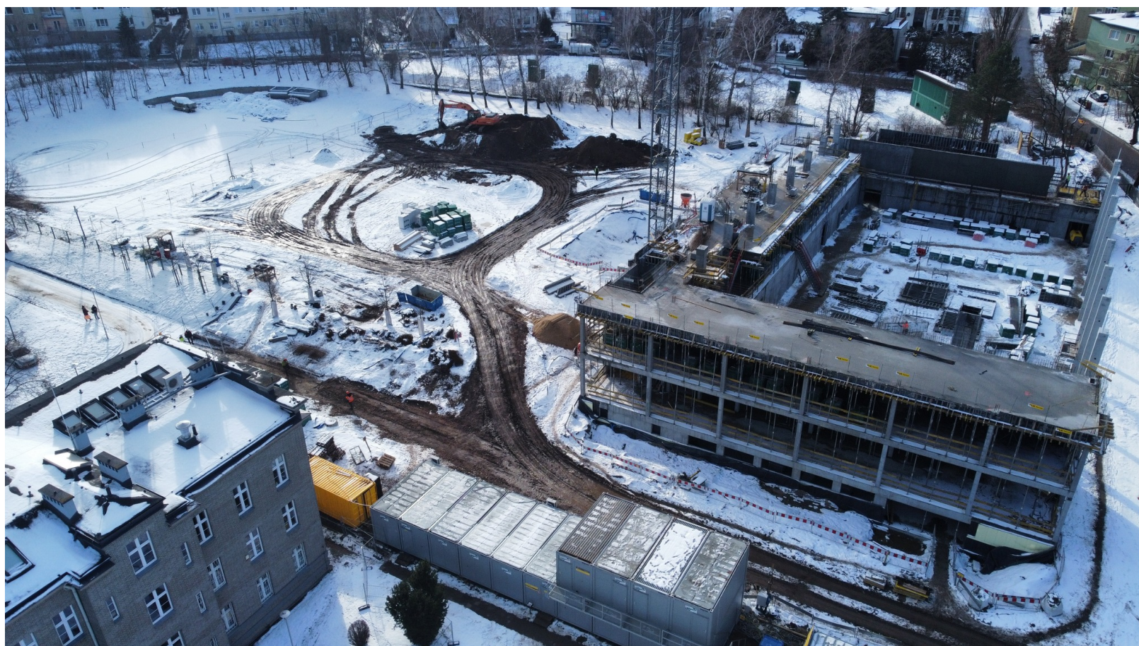
Hala rośnie w miejscu, w którym wcześniej wyburzono stary obiekt tego typu, fot. Uniwersytet Morski w Gdyni / mat. prasowe

Teraz Uniwersytet Morski chwali się już w sieci pierwszymi efektami prac. Jedna czwarta zakresu już za wykonawcą, czyli firmą Budimex. Dzięki temu przejeżdżając obok placu budowy z poziomu ulicy Grabowo możemy już dostrzec pnącą się w górę bryłę budynku, który docelowo będzie mieć prawie 12 metrów wysokości.