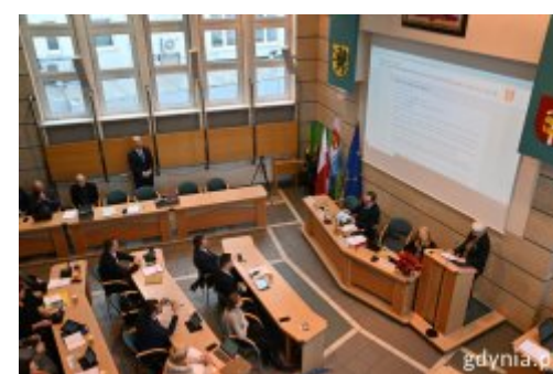
L sesja Rady Miasta Gdyni - transmisja na żywo