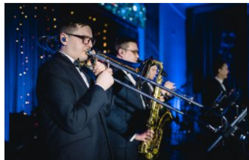
O oprawę muzyczną zadbał zespół „Commers Band”