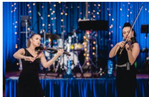
Muzyczną niespodzianką podczas balu był występ Ladies Violin Duo