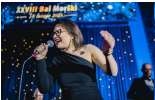
O oprawę muzyczną zadbał zespół „Commers Band”