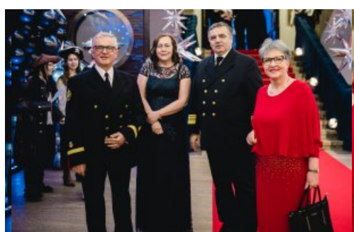
Na zdjęciu rektor UMG i zaproszeni goście