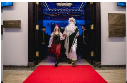
Nie zabrakło morskich akcentów