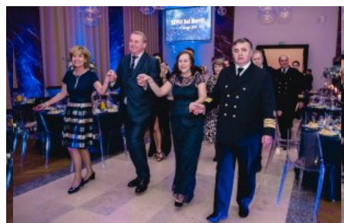
Jest bal, są tańce