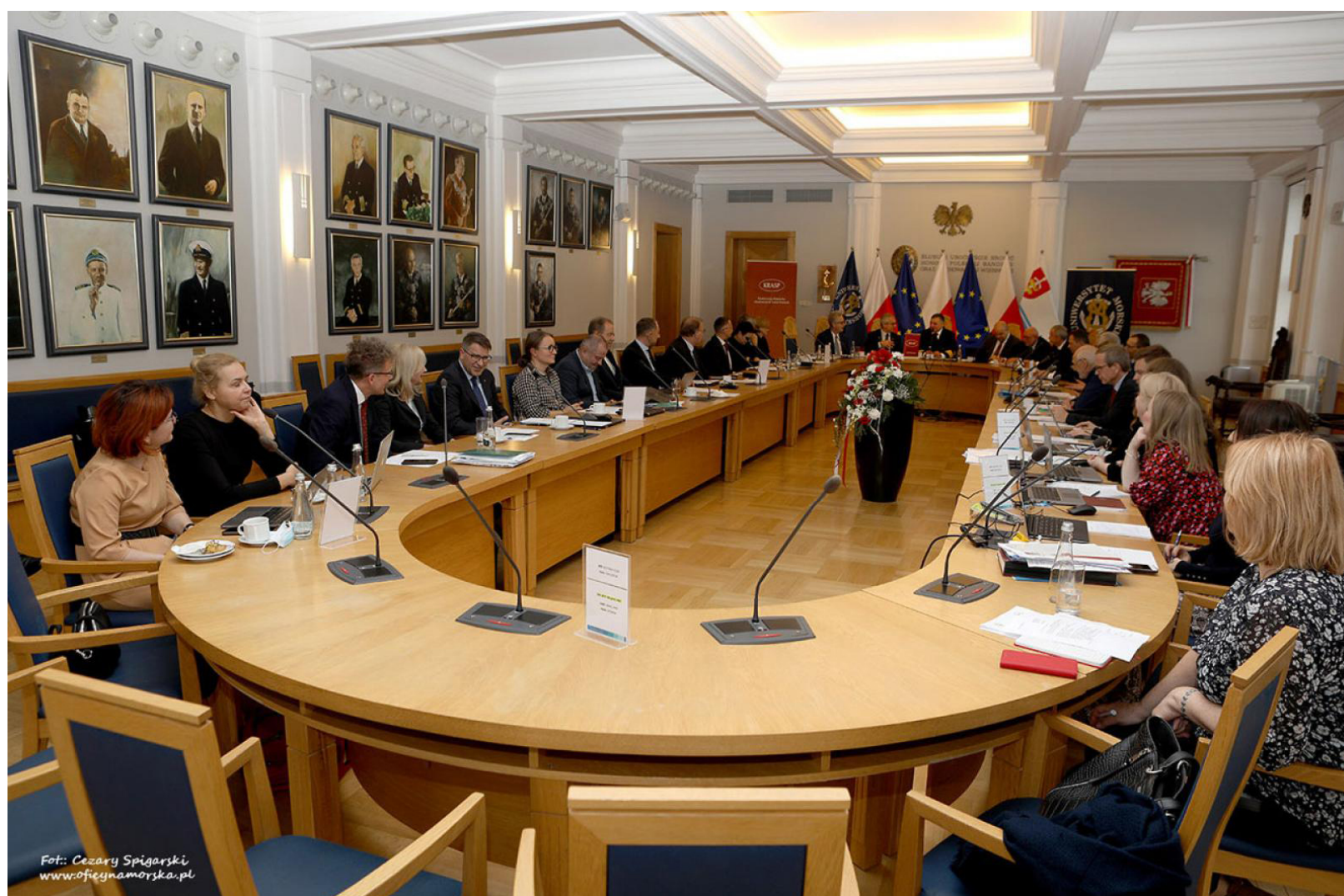
Konferencja Rektorów Akademickich Szkół Polskich na Uniwersytecie Morskim w Gdyni.

Rektorzy dyskutować będą również na temat zmian w Ustawie Prawo o szkolnictwie wyższym i nauce oraz ewaluacji jakości działalności naukowej, omówią propozycję uchwały w sprawie członkostwa zwyczajnego KRASP w Polskim Komitecie Olimpijskim oraz wydadzą stanowisko w sprawie sytuacji na granicy polsko-białoruskiej.