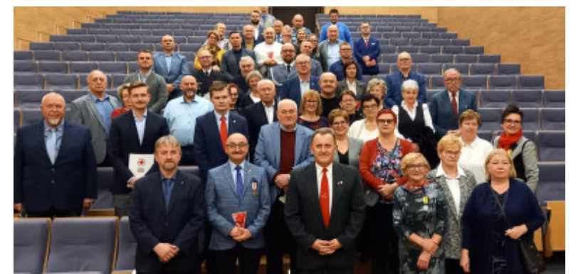
Dni Honorowego Krwiodawstwa w Gdyni. PCK wyróżniło dawców krwi [ZDJĘCIA]