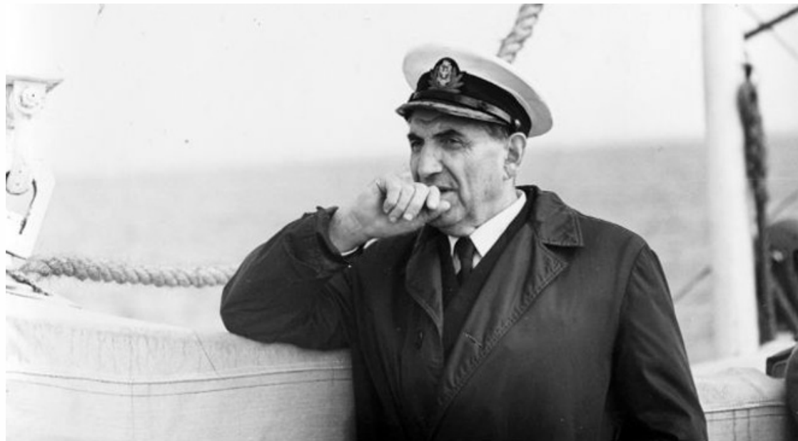
Kapitan Karol Olgierd Borchardt w 1974

25 marca 1905 roku urodził się Karol Olgierd Borchardt – kapitan żeglugi wielkiej, pisarz i nauczyciel wielu pokoleń polskich marynarzy. Na jego "Znaczy Kapitanie" wychowały się tysiące młodych ludzi.