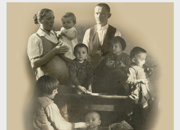
Rodzina Ulmów - symbol polskiej pomocy Żydom [ZOBACZ WIDEO]