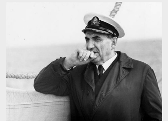
Karol Olgierd Borchardt – kapitan własnej duszy