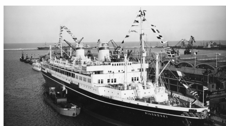
Transatlantyk "Piłsudski" - duma żeglugi II Rzeczypospolitej