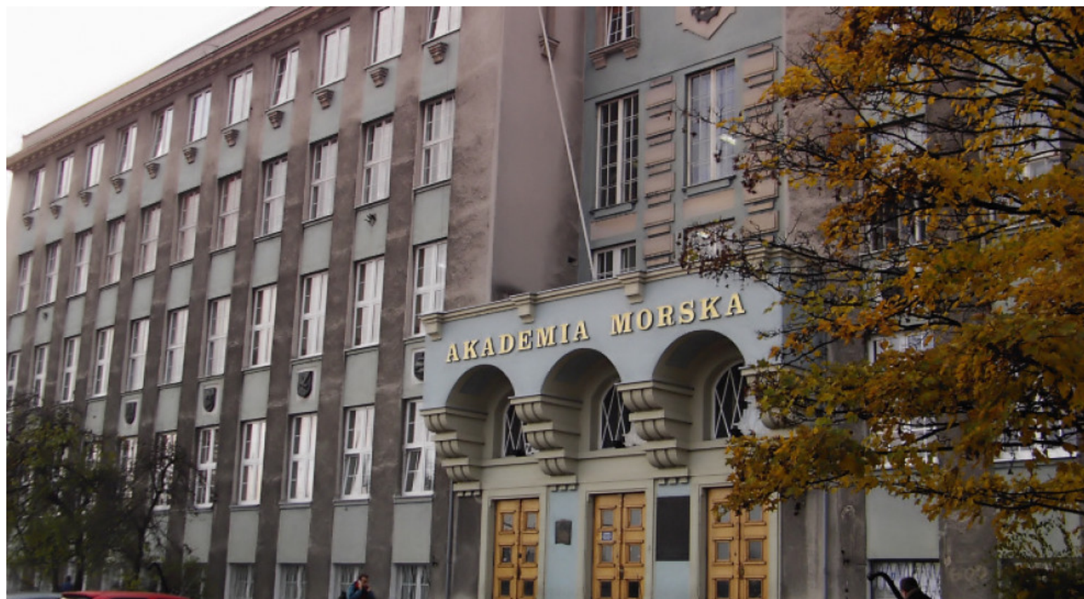
Uniwersytet morski w Gdyni