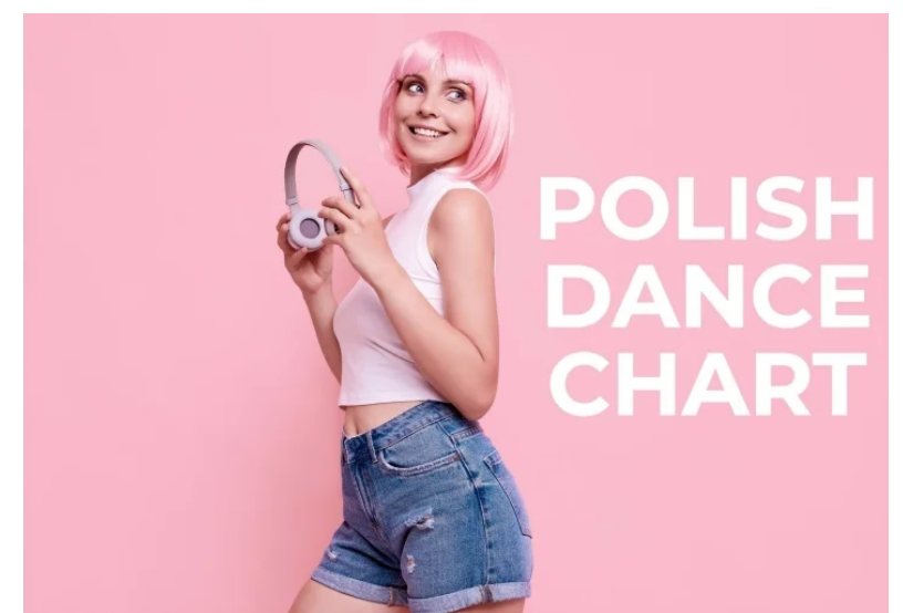
Polish Dance Chart - Radio Świnoujście

Powódź przy ulicy Hołdu Pruskiego! Od kilku lat woda zalewa mieszkańcom podwórko gdzie są garaże. Zobacz film!