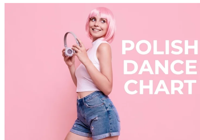
Polish Dance Chart - Radio Świnoujście

Szkolna Drużynowa Liga Lekkoatletyczna w ramach Igrzysk Młodzieży Szkolnej – 2021/2022