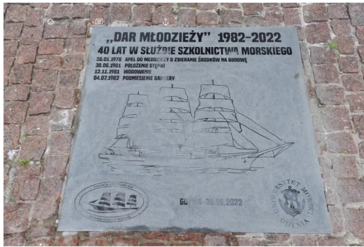
Tablica poświęcona „Darowi Młodzieży”.