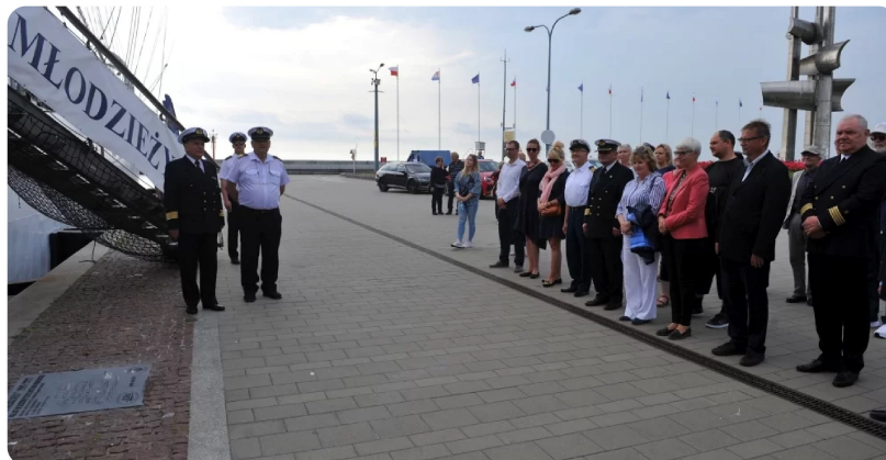
Uroczystość odsłonięcia tablicy.