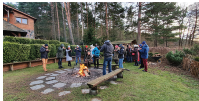
Wspólne ognisko.

W wydarzeniu uczestniczyło 60 osób. Podczas wyjazdu pracownicy korzystali ze strefy SPA (basen, sauny) oraz strefy rozrywkowej (bowling, bilard, piłkarzyki, dart, ping-pong), która cieszyła się szczególnym zainteresowaniem w piątkowy wieczór.