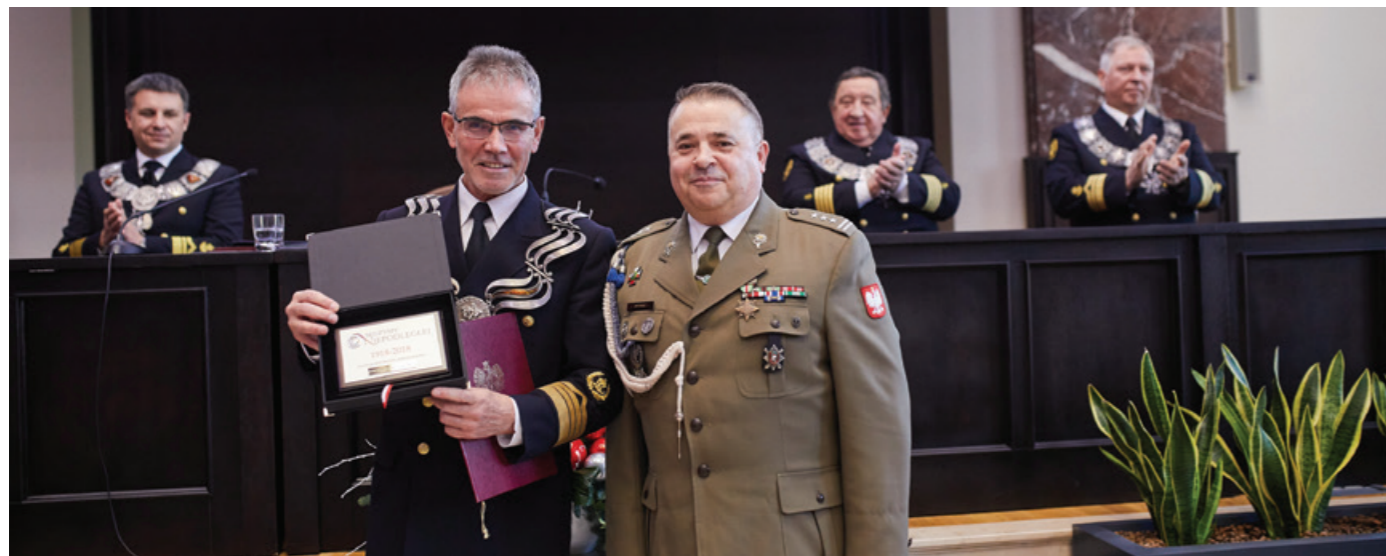
Pamiątkowy ryngraf za udział w programie Legia Akademicka.

Uniwersytet Morski w Gdyni przystąpił do III edycji ochotniczego szkolenia wojskowego dla studentów „Legia Akademicka”. Na początku stycznia zakończyła się rekrutacja do programu, w której wyłoniono 35 osób. Są to w większości studenci Uniwersytetu Morskiego, ale też innych trójmiejskich uczelni m.in. Akademii Muzycznej w Gdańsku.