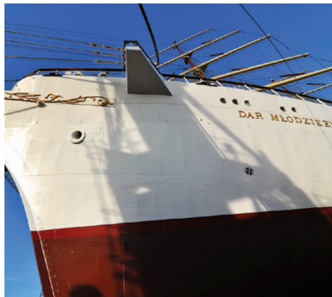
Remont Daru Młodzieży.

To pierwszy tak kompleksowy przegląd stoczniovy „Daru Młodzieży” od momentu zakończenia pracowitych sezonów lat 2018/2019. Fregata w tym czasie opłynęła świat, uczestniczyła w regatach i zlotach żaglowców na wodach zachodniej Europy, szkoliła studentów i uczniów szkół morskich.