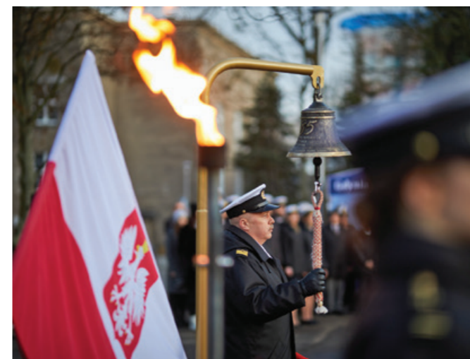
Apel Pamięci.