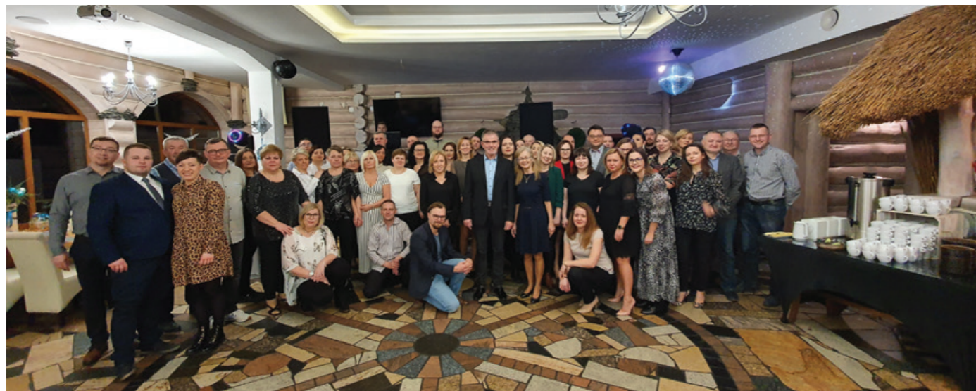
Pamiątkowe zdjęcie wszystkich uczestników wyjazdu.

Kolejny wyjazd integracyjny za nami! W dniach 17-19 stycznia 2020 roku, w hotelu „Adler Medical SPA” w miejscowości Zgorzałe koło Sulęcyna, odbył się wyjazd integracyjny dla pracowników Uniwersytetu Morskiego w Gdyni.