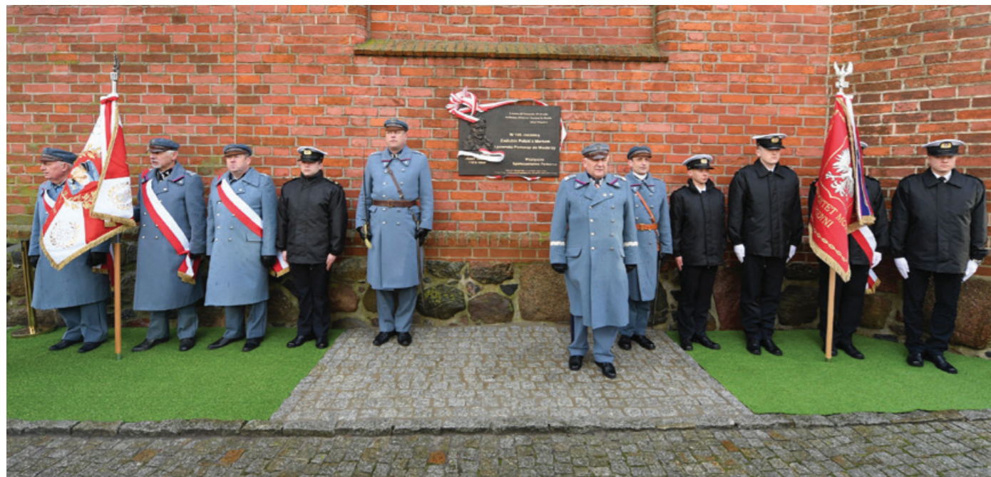
Posterunek honorowy wystawiony przez studentów Uniwersytetu Morskiego w Gdyni.

10 lutego 1920 r. to ważna data w historii Polski. Tego dnia gen. Józef Haller dokonał Zaślubin Polski z morzem wrzucając platynowy pierścień ofiarowany przez mieszkańców Gdańska w toń zatoki Puckiej. Drugi identyczny pierścień do końca życia nosił na swoim palcu. W ten symboliczny sposób dokonano się postanowienie Traktatu Wersalskiego o przywróceniu Polsce dostępu do morza.