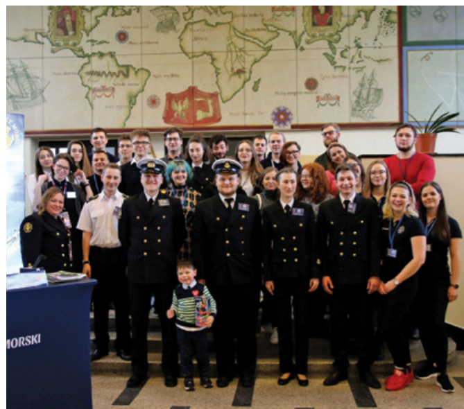
Studenci zbierający pieniądze podczas Wielkiej Orkiestry Świątecznej Pomocy.

„Dla zapewnienia najwyższych standardów diagnostycznych i leczniczych w dziecięcej medycynie zabiegowej” - takie hasło przyświecało tegorocznemu Finałowi Wielkiej Orkiestry Świątecznej Pomocy.