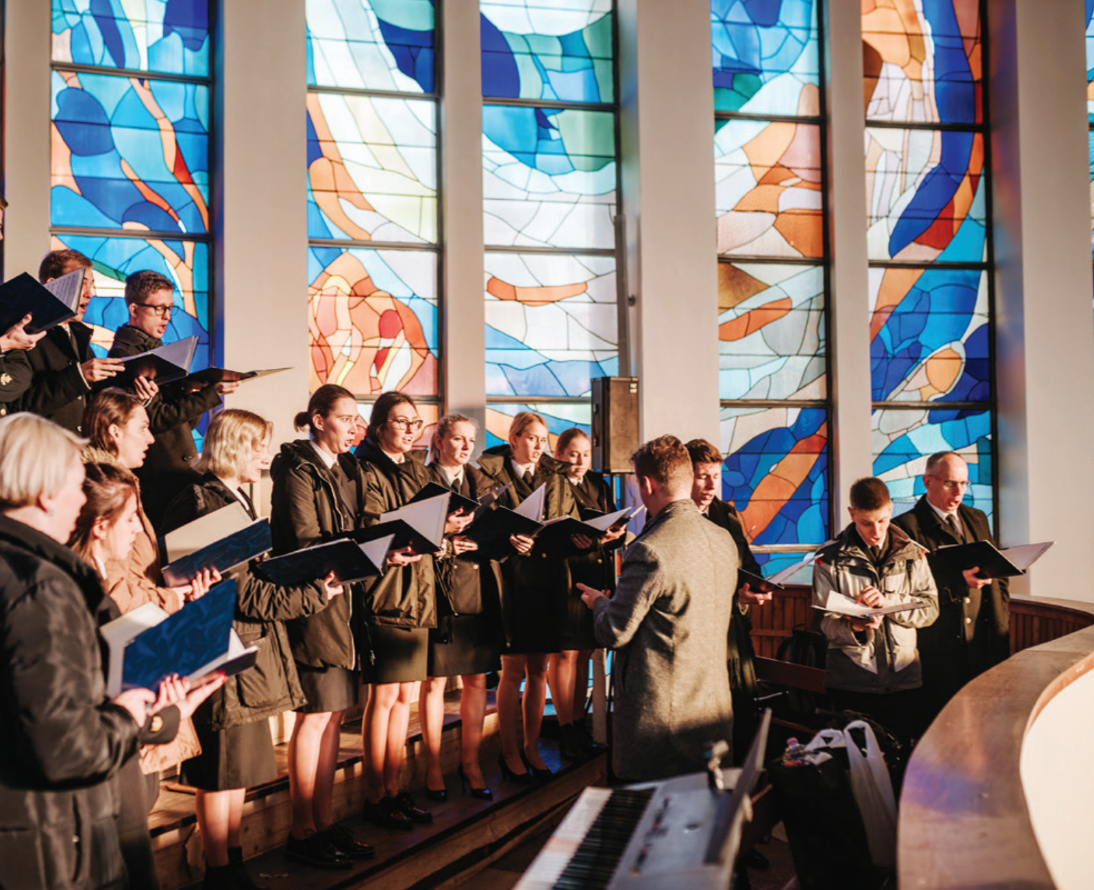
Występ Akademickiego Chóru UMG podczas Mszy Św.