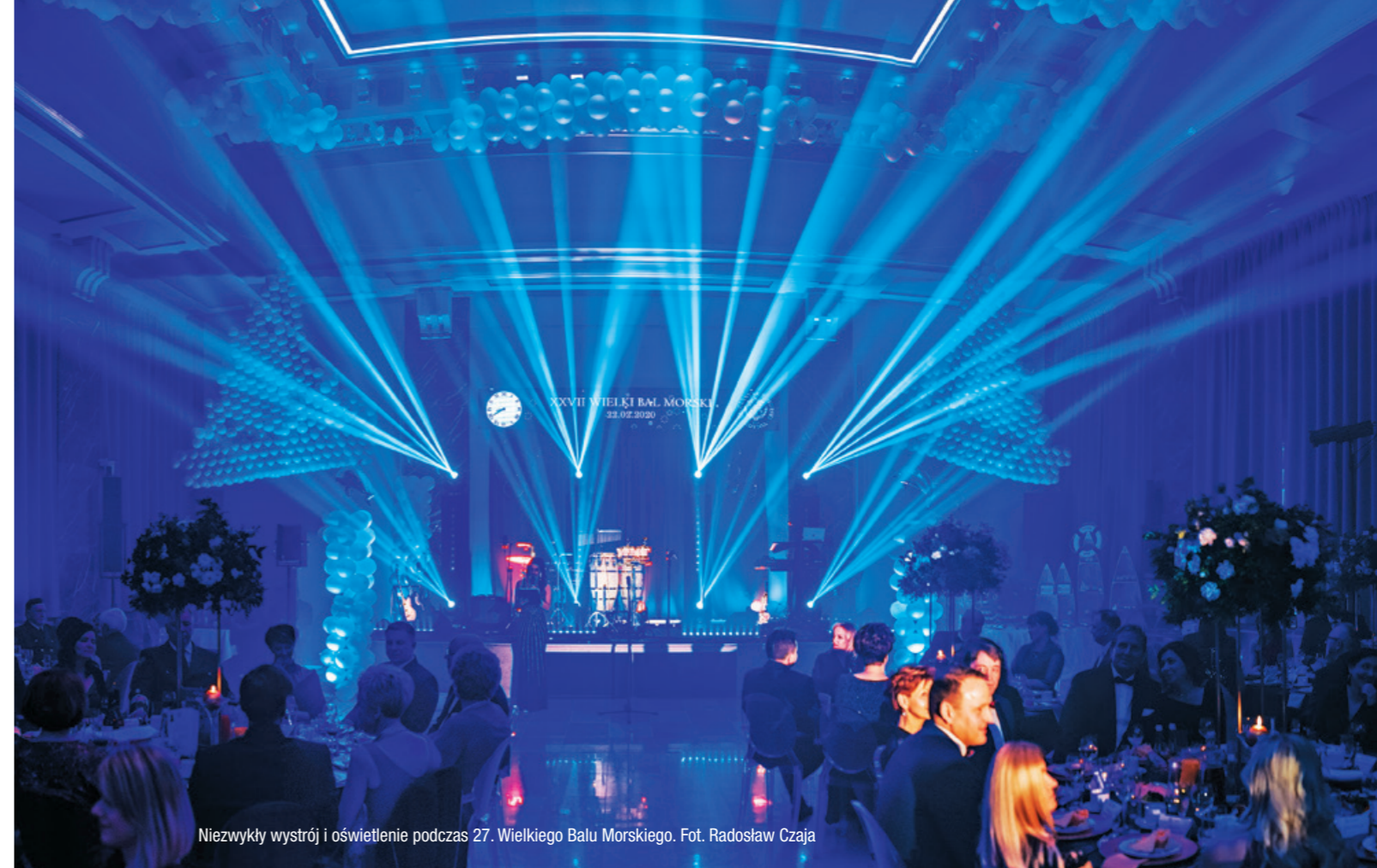
Niezwykły wystrój i oświetlenie podczas 27. Wielkiego Balu Morskiego.