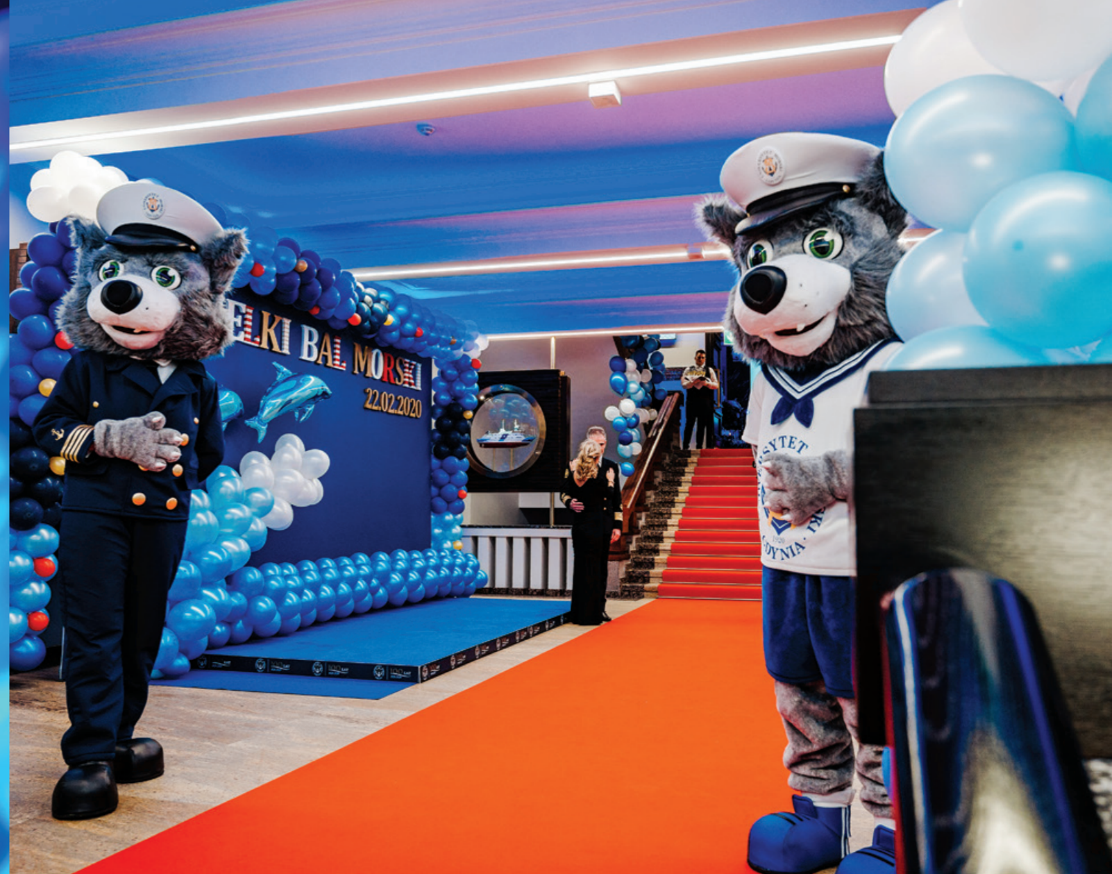
Wilki Morskie witające gości.