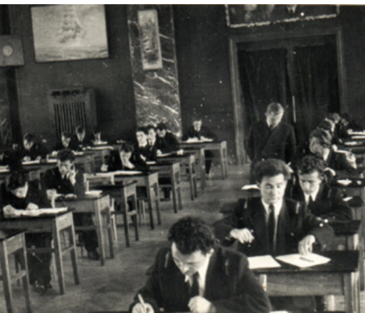
Egzamin w auli PSM-ki.

Formalnie historia najmłodszego uniwersytetu w Polsce zaczęła się 100 lat temu. W środę, 8 grudnia 1920 roku, przed budynkiem dawnego gimnazjum żeńskiego w Tczewie, podniesiono biało-czerwoną banderę inaugurując oficjalnie pierwszy rok nauki w pierwszej Szkole Morskiej w historii Rzeczypospolitej. Dzisiaj kontynuatorem tradycji kształcenia kadr morskich jest Uniwersytet Morski w Gdyni.