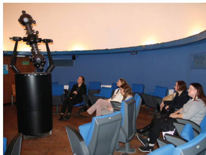
Wizyta w Planetarium im. Antoniego Ledóchowskiego.

W dniach 2-6 grudnia 2019 roku Uniwersytet Morski w Gdyni wraz z Urzędem Marszałkowskim Województwa Pomorskiego, Urzędem Miasta Gdańska, Uniwersytetem Gdańskim, Politechniką Gdańską, Gdańskim Uniwersytetem Medycznym, Akademią Sztuk Pięknych w Gdańsku, Akademią Muzyczną w Gdańsku oraz Wyższą Szkołą Administracji i Biznesu zrealizował tydzień wizyt studyjnych przedstawicieli partnerskich uczelni w ramach programu Erasmus.