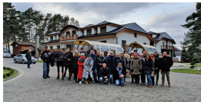
Przejazd wozami drabiniastymi.

Drugiego dnia, w sobotę, odbyła się przejażdżka wozami drabiniastymi zorganizowana przez Stajnię Cantharis. Większość uczestników czas wolny spędzała aktywnie – uprawiając jogging po pięknej okolicy, spacerując po lesie lub morsując