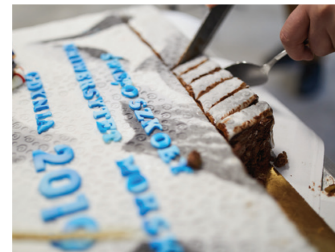
Tort z okazji Święta Szkoły.