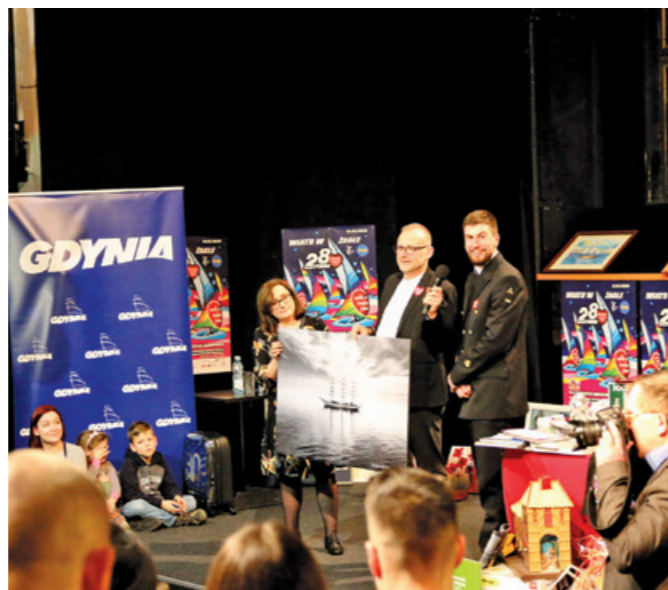
Wielka Orkiestrowa Licytacja w Teatrze Miejskim w Gdyni.

Podczas 28. Finału Wielkiej Orkiestry Świątecznej Pomocy w budynku Wydziału Nawigacyjnego do puszek zebraliśmy 3500 złotych. Dziękujemy! Tradycyjnically, do wielkiego grania włączyli się również pracownicy i studenci Wydziału Mechanicznego, którzy wykonali niezwykłą, marynistyczną lampę wylicytowaną za 900 złotych podczas Wielkiej Orkiestrowej Licytacji w Teatrze Miejskim im. Witolda Gombrowicza w Gdyni. Studenci licytowali również wyjątkowe zdjęcie Daru Młodzieży wykonane przez