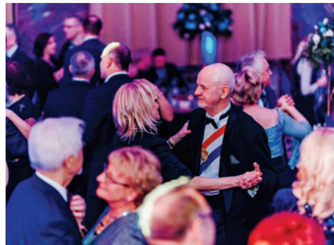
Szampańska zabawa trwała do białego rana.