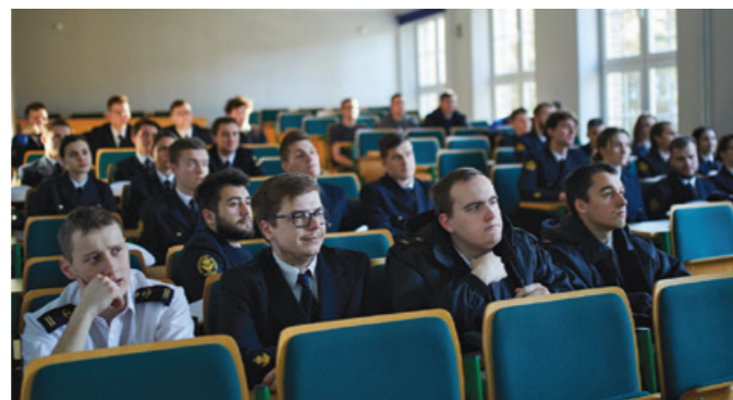
Studenci podczas wykładu z przedstawicielem WKU.

Część teoretyczna tegorocznej edycji wzbogacona jest o platformę e-learningową, pozwalającą na jeszcze lepsze zrozumienie