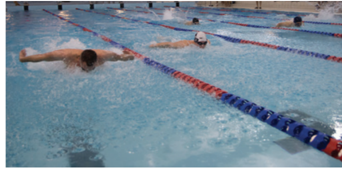
Rywalizacja między zawodnikami była zacięta.