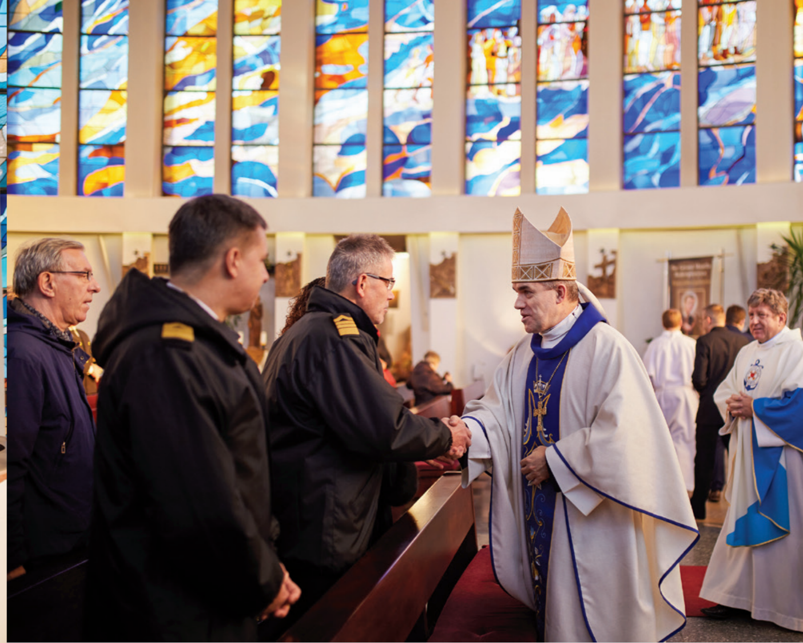
Msza Św. w intencji pracowników, studentów, doktorantów oraz absolwentów UMG.

Obchody Święta Uniwersytetu Morskiego w Gdyni (UMG) rozpoczęło podniesienie bandery przed frontem uczelni oraz msza św. w intencji pracowników, studentów, doktorantów oraz absolwentów.