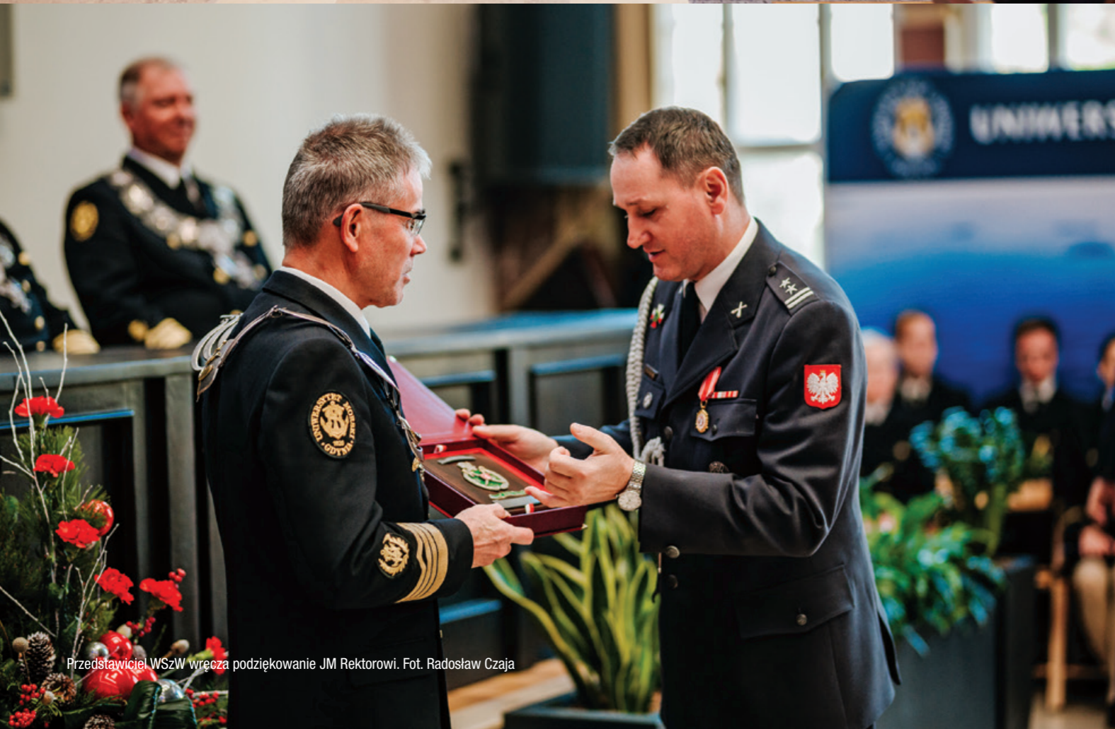
Przedstawiciel WSZW wręcza podziękowanie JM Rektorowi.