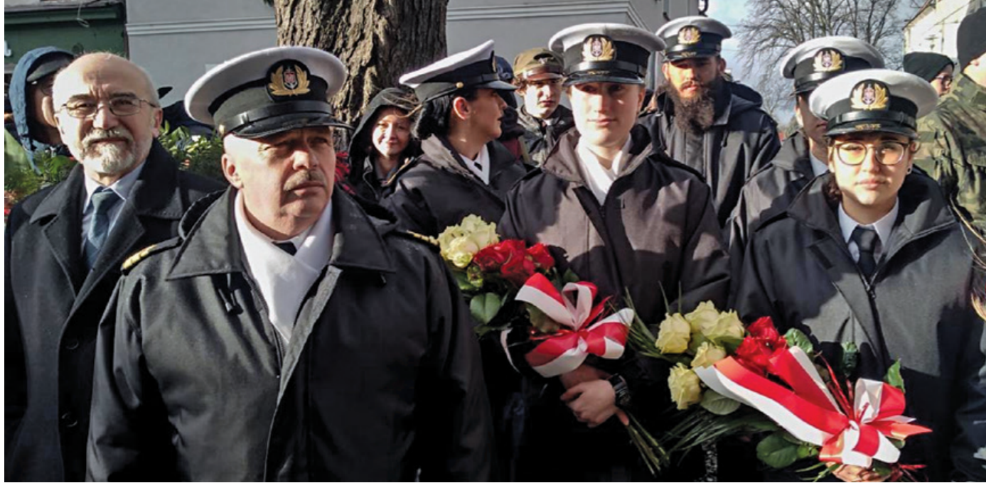
Kompania Reprezentacyjna UMG podczas 100. Rocznicy Zaślubin Polski z Morzem w Pucku.