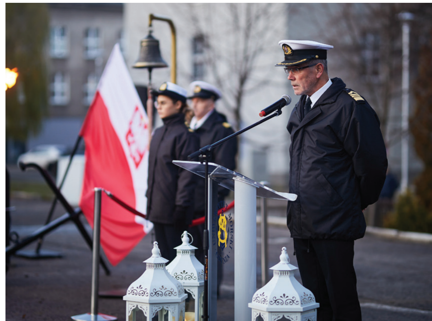
Tradycyjny Apel Pamięci z okazji Święta Szkoły.