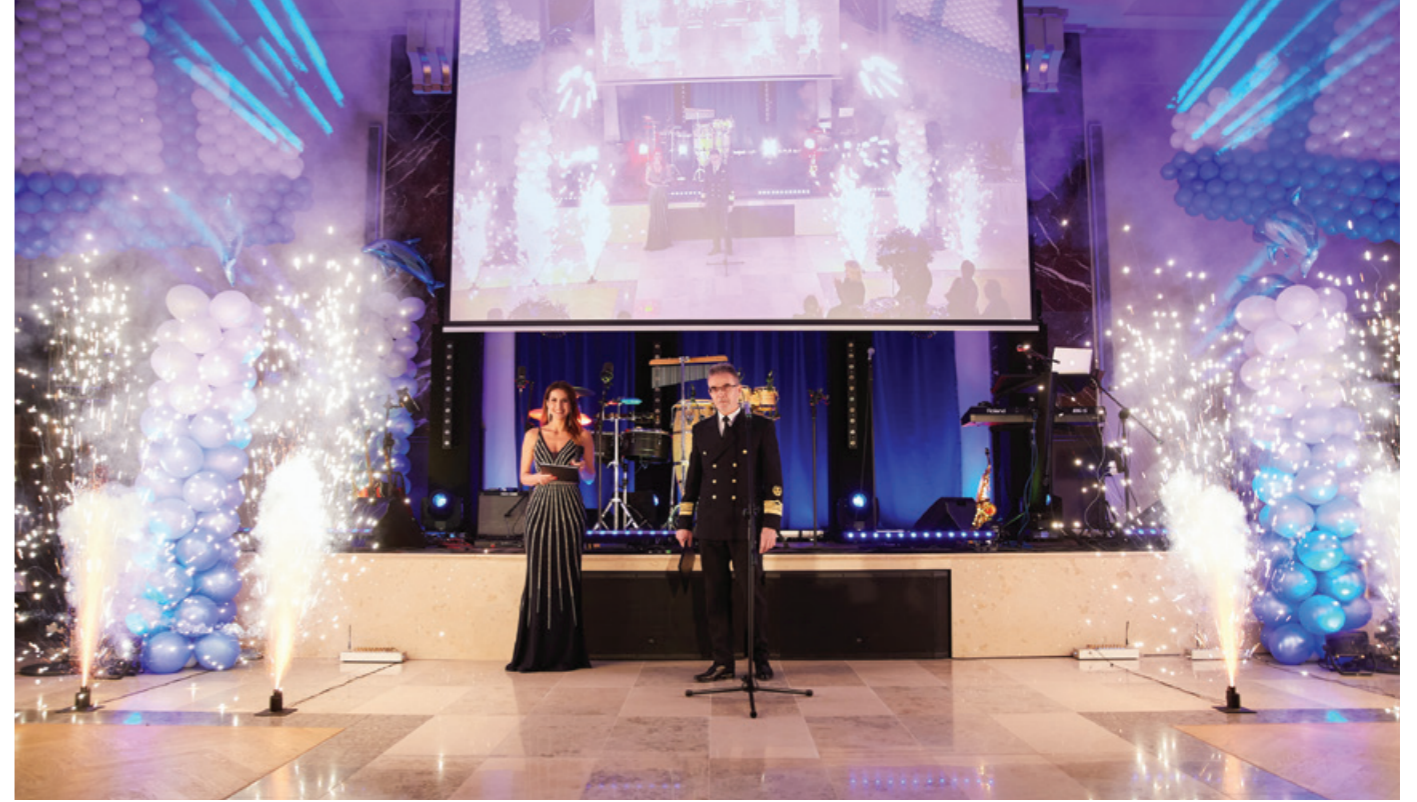
Otwarcie 27. Wielkiego Balu Morskiego.