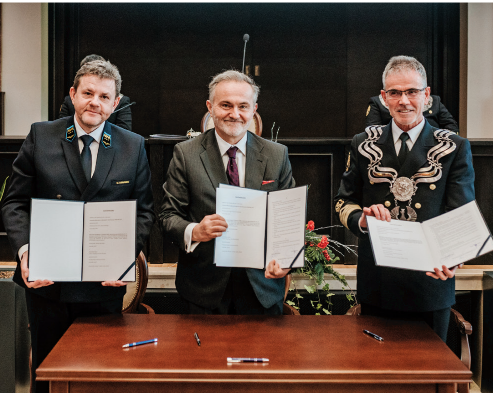
Podpisanie listu intencyjnego.

Podpisanie listu intencyjnego w sprawie zmiany nazwy przystanku Szybkiej Kolei Miejskiej, wręczenie odznaczeń państwowych, nagród jubileuszowych, dyplomów potwierdzających nadanie stopnia naukowego doktora habilitowanego i dyplomów doktorskich to tylko niektóre z punktów programu 99. Święta Uniwersytetu Morskiego w Gdyni, które odbyło się wyjątkowo nie 8, a 9 grudnia 2019 roku.