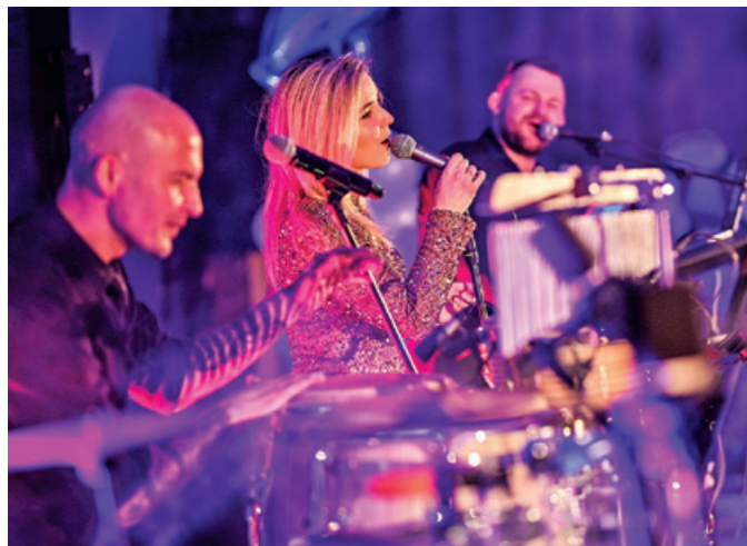
O oprawę muzyczną zadbał znakomity zespół „Marynowsky & Live Act”