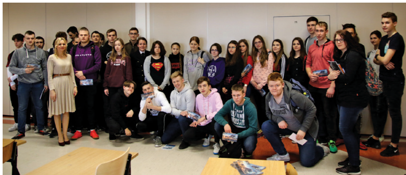
Pracownicy Uniwersytetu Morskiego w Gdyni z uczniami Zespołu Szkół Ponadgimnazjalnych w Przdokowie.

Pracownicy i studenci Uniwersytetu Morskiego w Gdyni przez cały rok reprezentują naszą Uczelnię podczas prezentacji w szkołach średnich.