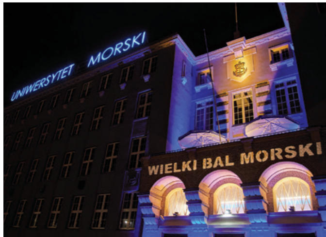
Front Uczelni podczas 27. Wielkiego Balu Morskiego.