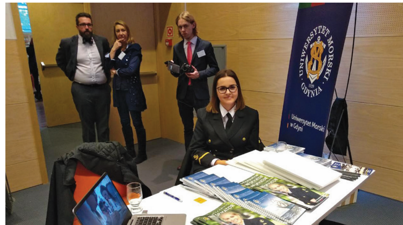
Stoisko Uniwersytetu Morskiego w Gdyni.

Już drugi rok z rzędu Gdyńska Rada Turystyczna zaprosiła UMG do uczestnictwa w wydarzeniu promującym Gdynię, jako miejsce atrakcyjne dla partnerów biznesowych.