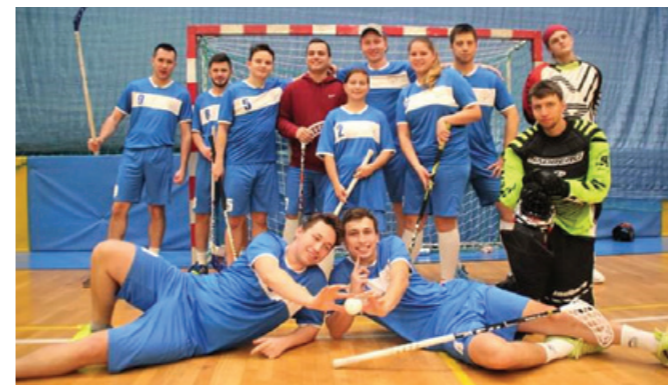
Reprezentacja Uniwersytetu Morskiego w Gdyni.

Studenci Uniwersytetu Morskiego w Gdyni brali udział w trzecim Akademickim Pucharze Polski w Unihokeju, który odbył się 9 listopada 2019 roku w Warszawie.