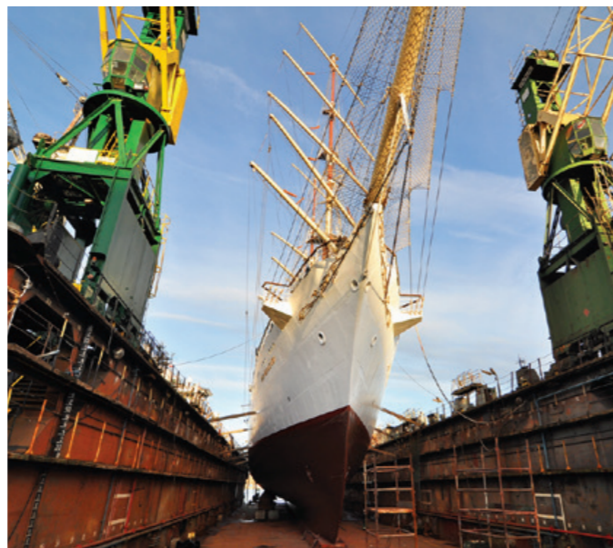
Dar Młodzieży w suchym doku.

W ramach prac remontowych, tzw. odnowienia klasy, żaglowiec pod koniec stycznia trafił na dok gdyńskiej Stoczni Remontowej „Nauta”.