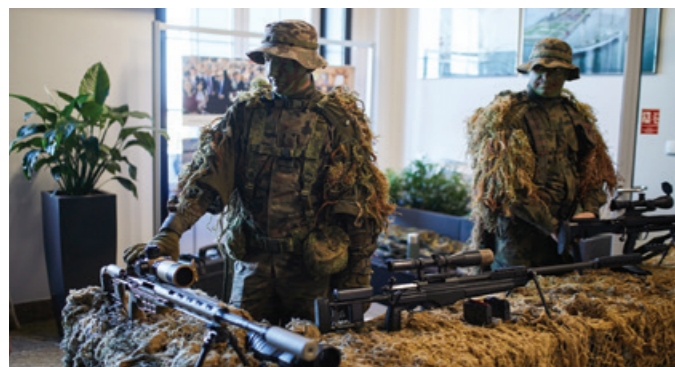
Prezentacja Wojsk Obrony Terytorialnej.

Program „Legia Akademicka” skierowany jest do studentów, zarówno kobiet jak i mężczyzn, którzy chcieliby odbyć szkolenie wojskowe oraz uzyskać stopień wojskowy. Organizatorem części teoretycznej szkolenia, obejmującej m.in. przedmioty z zakresu obronności i wiedzy wojskowej jest Uniwersytet Morski. Część praktyczną wojskowego szkolenia w formie ćwiczeń poligonowych organizuje Ministerstwo Obrony Narodowej.