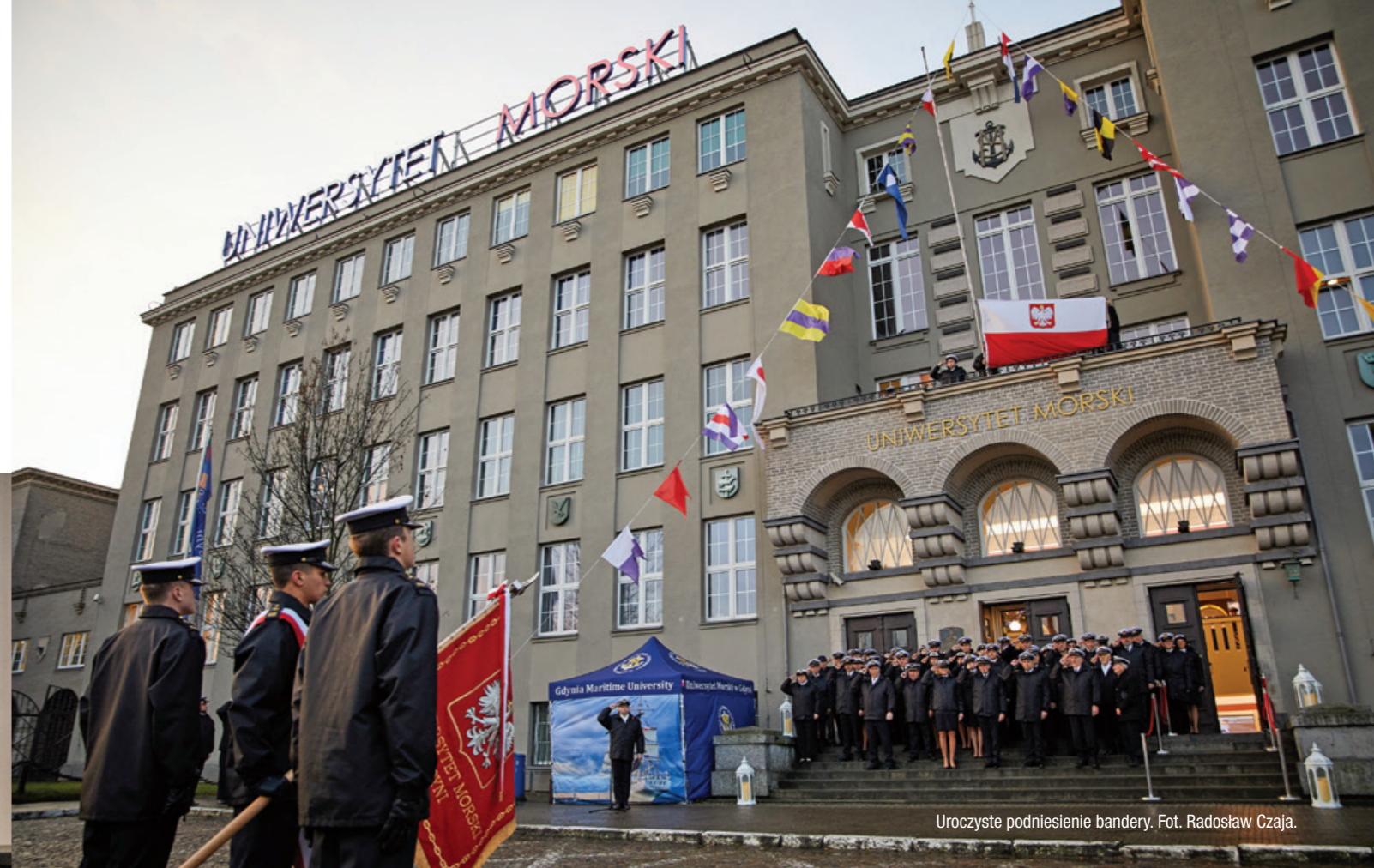
Uroczyste podniesienie bandery.