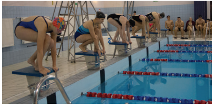
Rozpoczęcie zawodów pływackich.

Z okazji Święta Szkoły w dniu 26 listopada 2019 roku na pływalni UMG odbyły się Międzywydziałowe Zawody Pływackie w których wzięła udział rekordowa liczba 290 zawodników. W stosunku do ubiegłego roku liczba ta wzrosła o 121 zawodników.