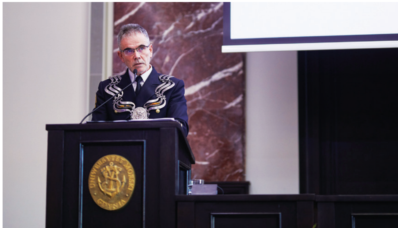
Przemówienie JM Rektora podczas Święta Szkoły.