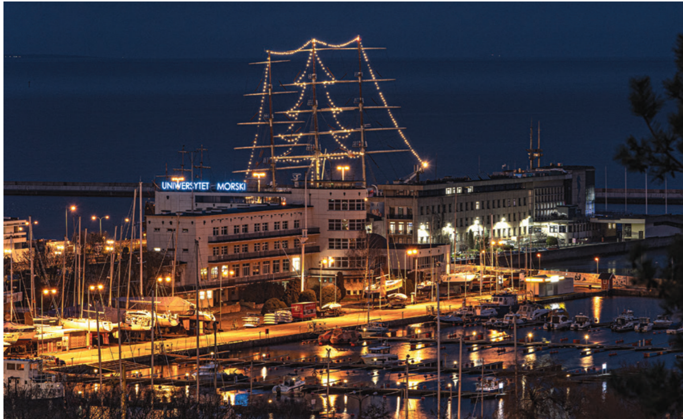
Choinka z lampek na grot-maszcie Daru Młodzieży.