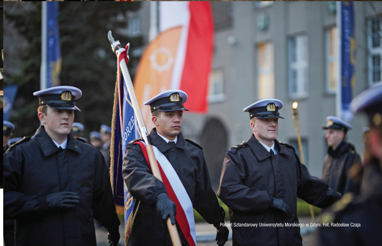
Poczet Sztandarowy Uniwersytetu Morskiego w Gdyni.