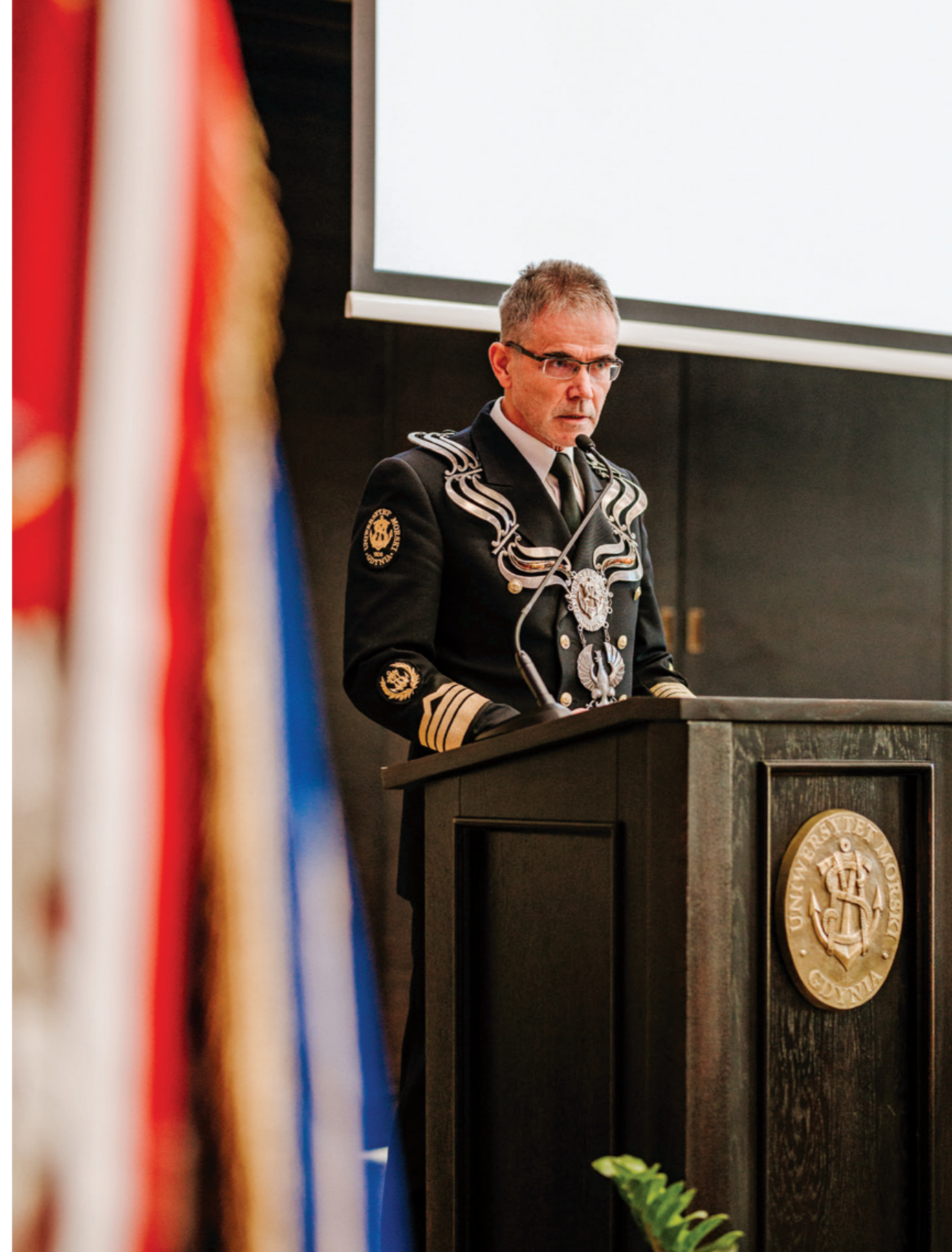
Wystąpienie JM Rektora podczas Uroczystego Senatu.

Z Ministerstwa Nauki i Szkolnictwa Wyższego otrzymaliśmy ponad 15 mln zł w obligacjach Skarbu Państwa, które przeznaczymy na inwestycje służące całej wspólnocie akademickiej, będzie to hala sportowa, dom studencki i nowa siedziba Instytutu.