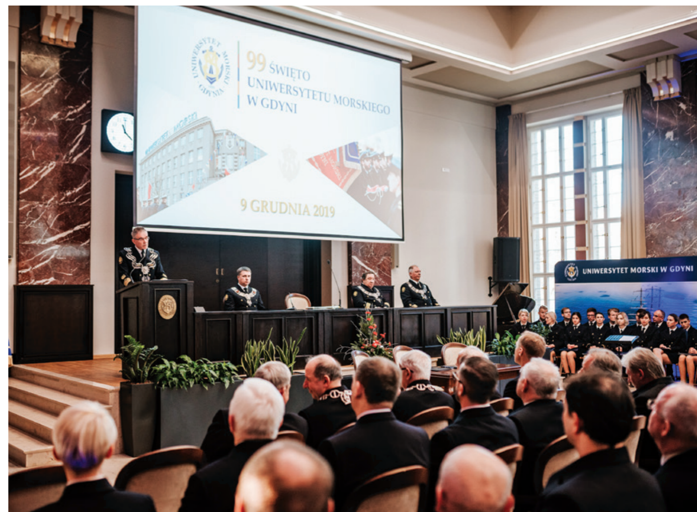
Uroczysty Senat.

Już za chwilę zostanie uroczyste podpisane stosowne porozumienie pomiędzy Gminą Miasta Gdynia, PKP SKM oraz naszym Uniwersytetem.