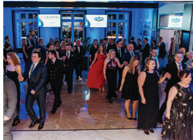
Tradycyjny Polonez.