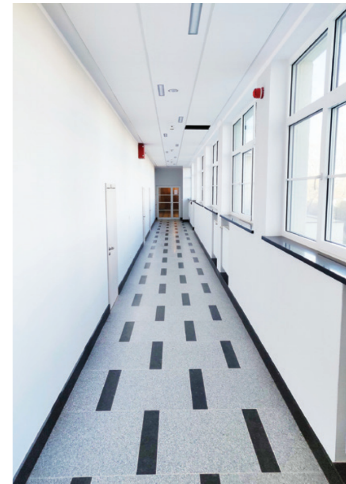
Odnowiony hol w budynku Wydziału Nawigacyjnego.