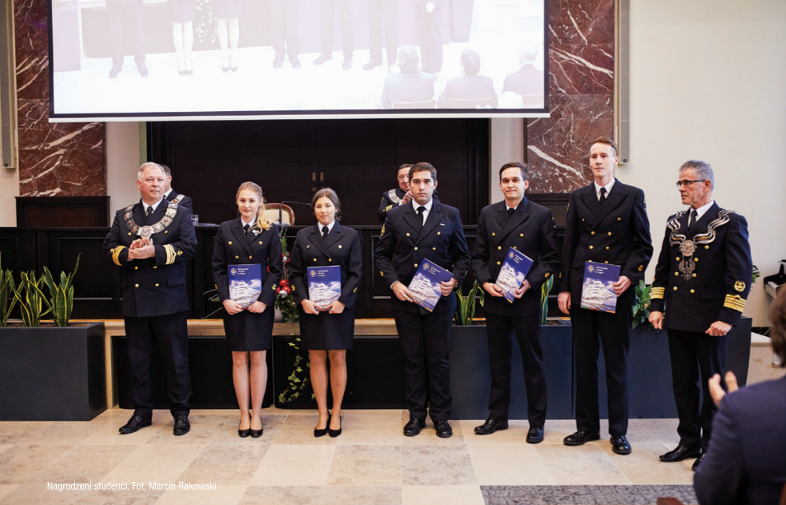
Nagrodzeni studenci.