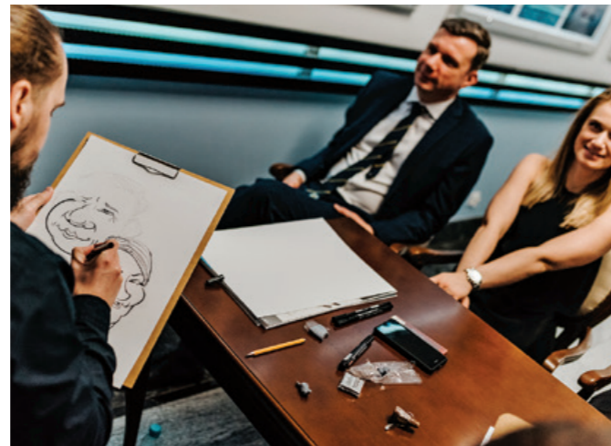
Goście mogli otrzymać swoje karykatury.