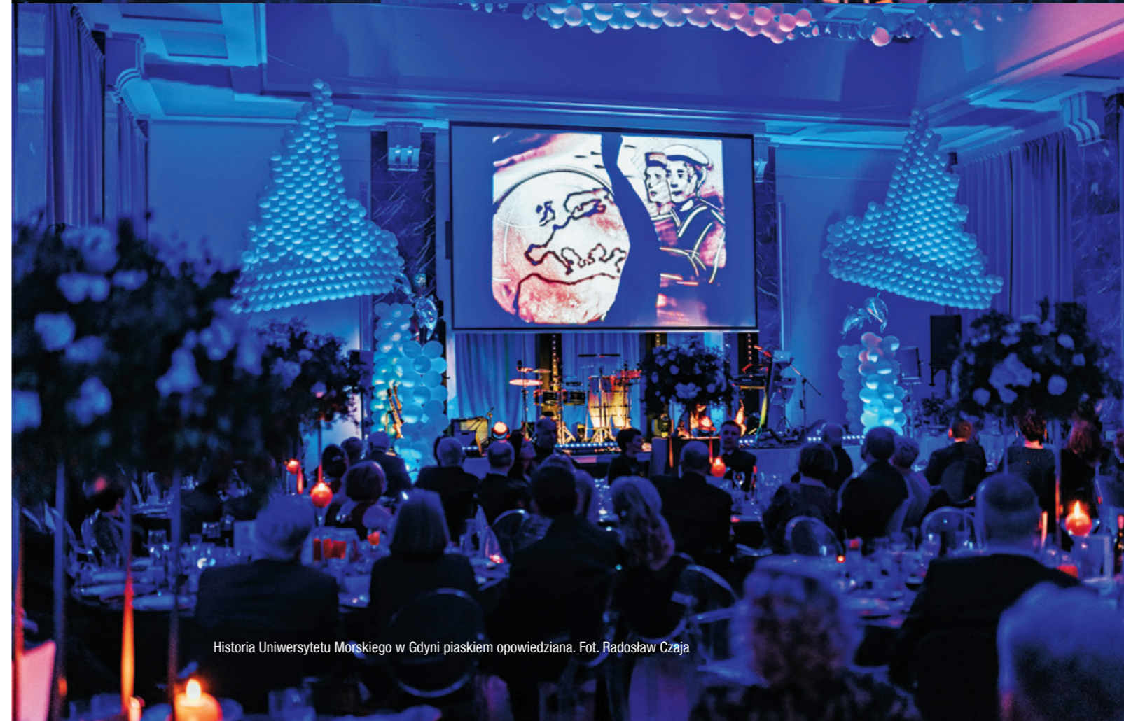
Historia Uniwersytetu Morskiego w Gdyni piaskiem opowiedziana.