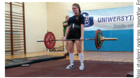
Nasi studenci podczas zawodów.