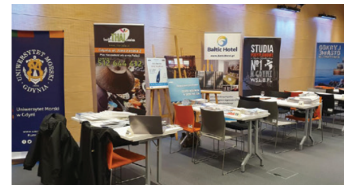
Podczas wydarzenia prezentowały się różne firmy i instytucje.