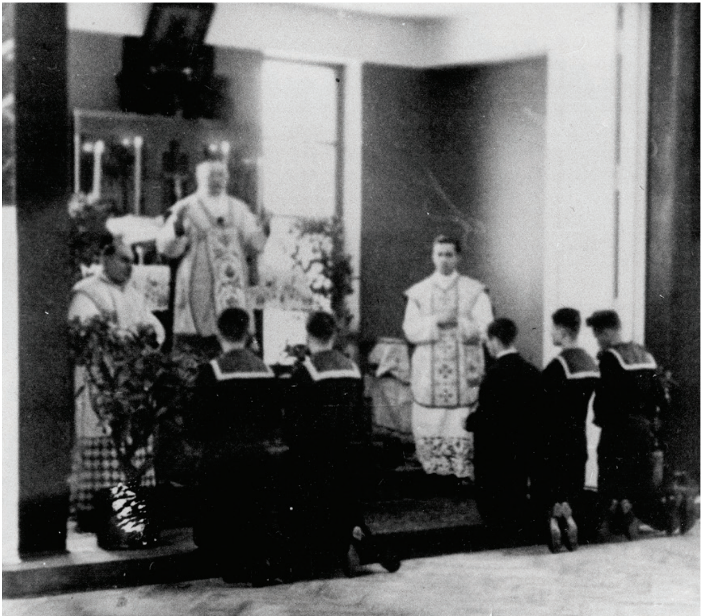
Msza w auli z okazji Święta Szkoły 1945

1938 roku obchodzony był bardzo uroczyście. Wybuch II wojny światowej zmusił słuchaczy Szkoły Morskiej do zdania najtrudniejszego w swoim życiu wojennego egzaminu. Po wojnie w reaktywowanej Państwowej Szkole Morskiej, Święto Szkoły obchodzono sporadycznie, ponieważ było niewygodne dla władz komunistycznych. Przełom nastąpił 7 lipca 1990 roku, kiedy to senat Wyższej Szkoły Morskiej w Gdyni na prośbę Koła Tczewiaków podjął uchwałę o przywróceniu tradycyjnego Święta Szkoły. Pierwsze po długiej przerwie Święto Szkoły odbyło się 8 grudnia 1990 roku dla uczczenia 70-lecia uczelni. Opracowana wówczas formuła obchodów tego ważnego dla uczelni dnia, kultywowana jest nieprzerwalnie do dziś.